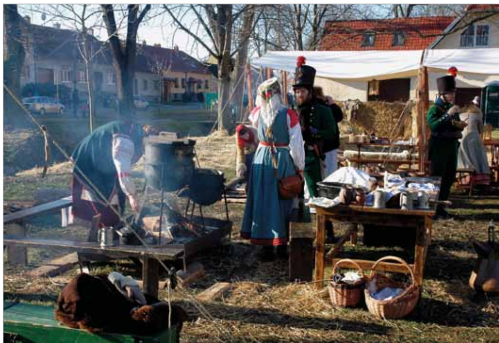
Vojenské ležení na návsi, 3. prosince 2016