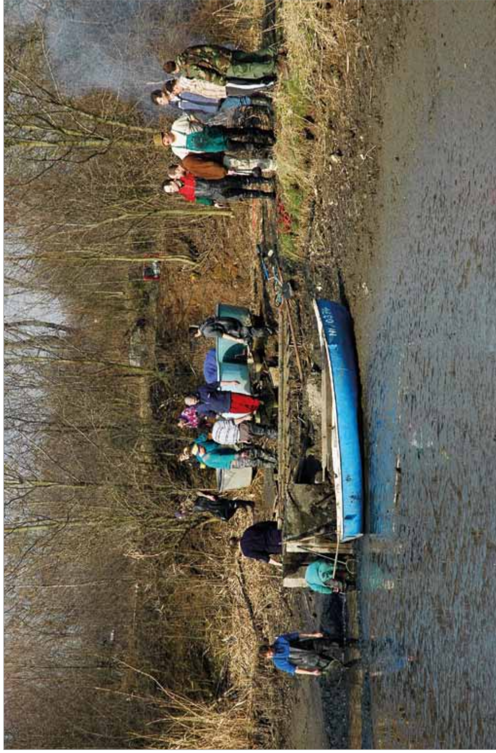
Výlov rybníka pod Hrubou skálou, rok 2007