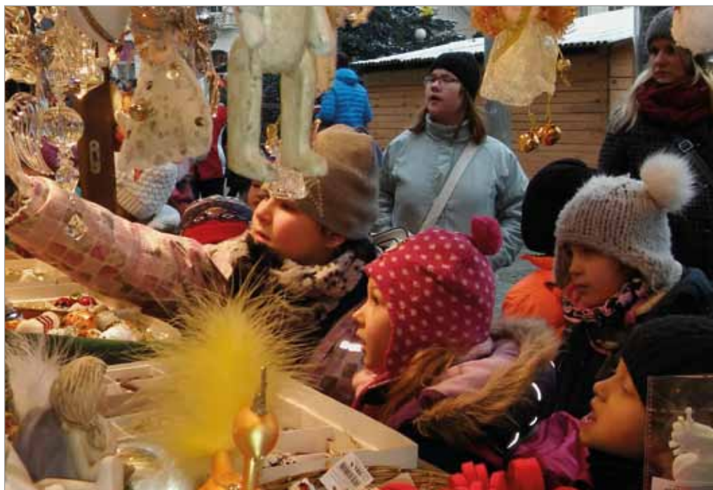
Základní škola na jarmarku v Brně, 21. prosince 2016