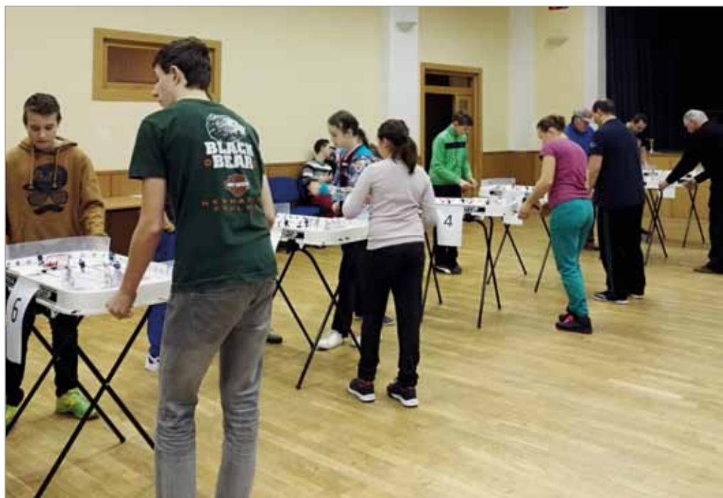
Mikulášský turnaj ve stolním hokeji STIGA, Orel jednota Tvarožná, 10. prosince 2016