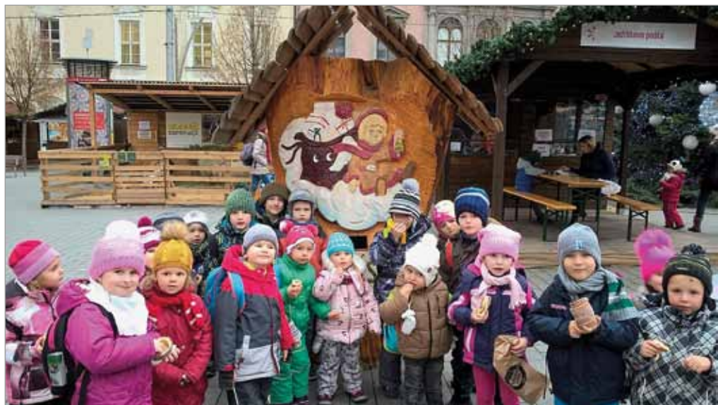
Výlet MŠ do adventního Brna, 1. prosince 2016