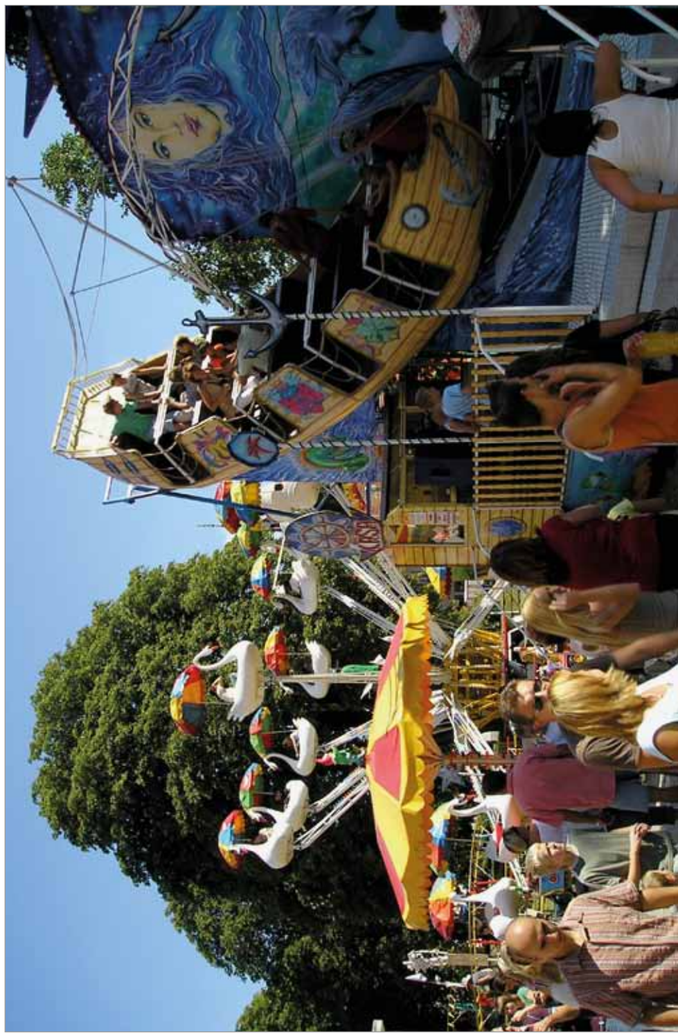
Tvořenská pouť, rok 2007