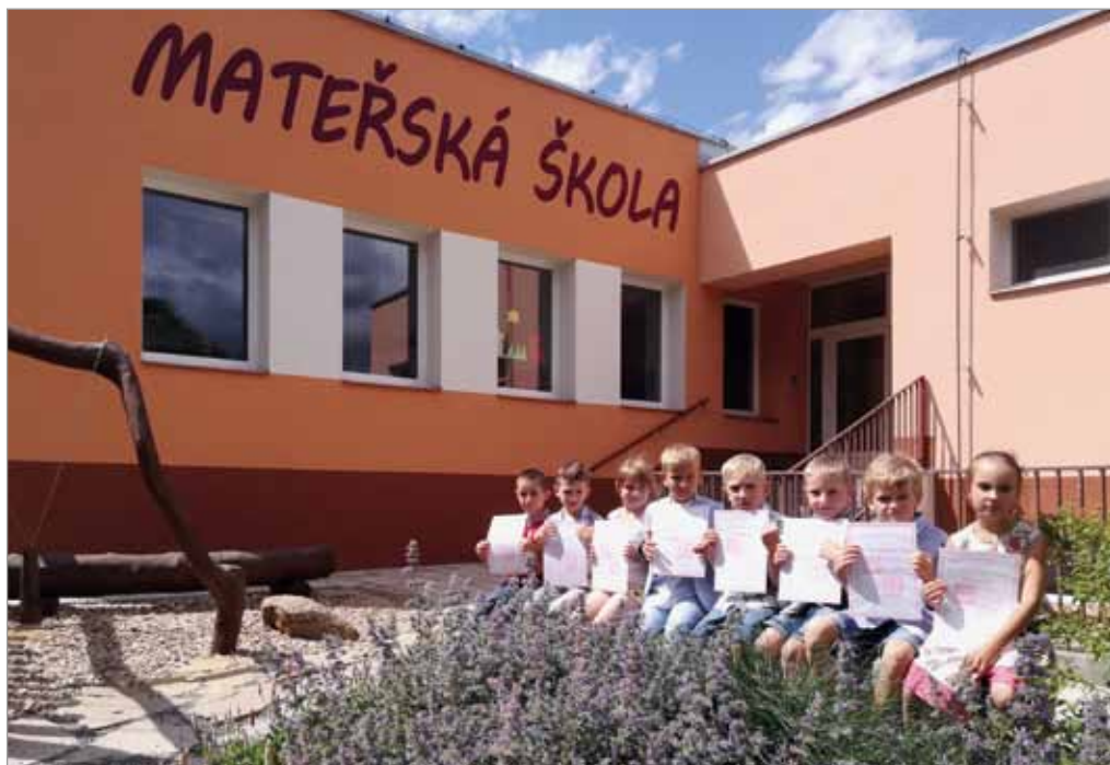
Budoucí prvňáčci s vysvědčením MŠ, 29. června 2017