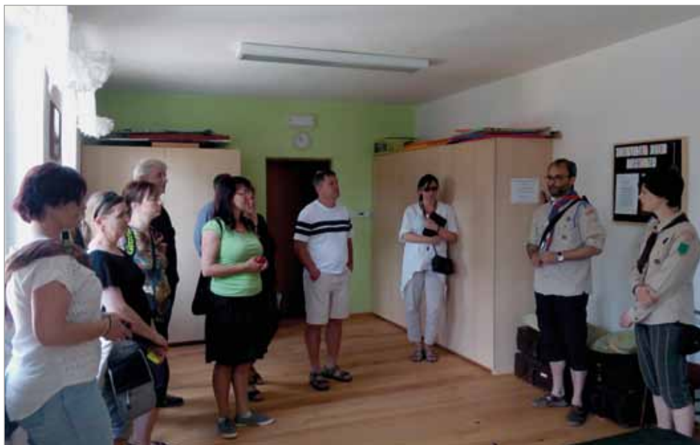
Návštěva krajské hodnotící komise soutěže Vesnice roku ve skautské klubovně, 1. června 2017