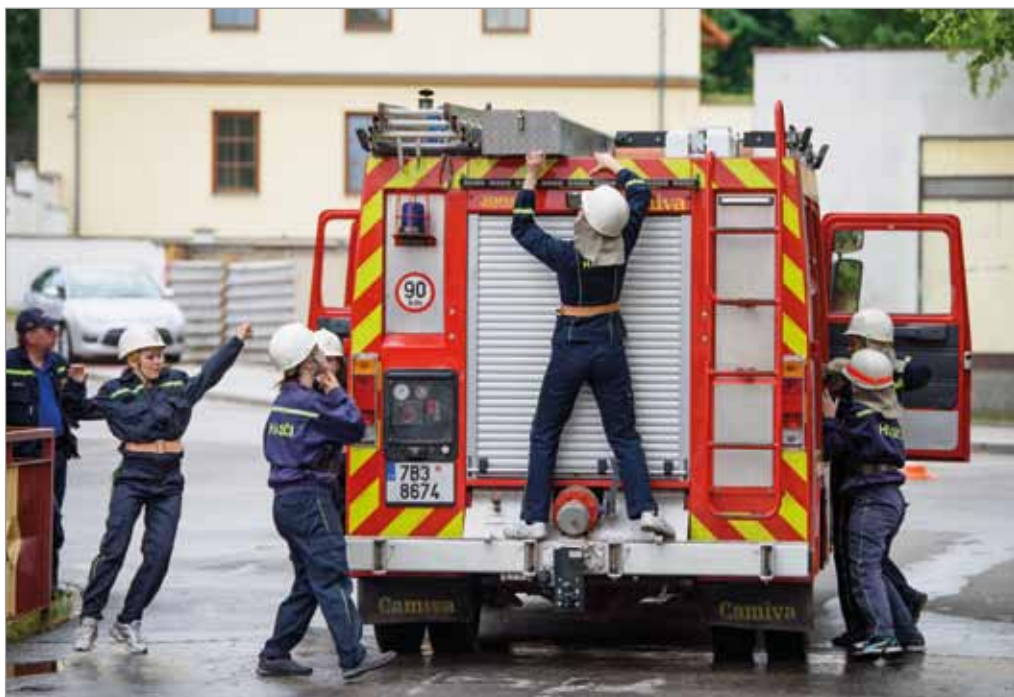
Soutěž hasičských družstev O putovní pohár zastupitelstva obce Tvarožná, 4. června 2017