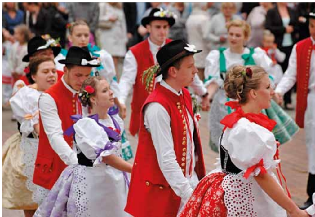
Tvaroženské hody, 17. června 2017