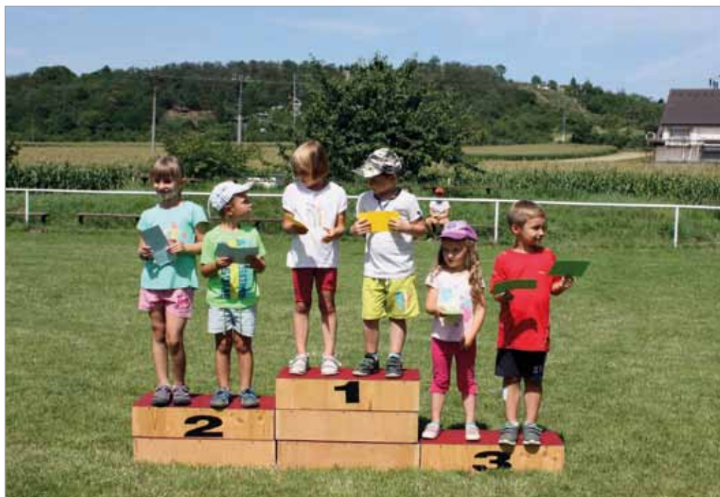
Tvaroženská olympiáda TJ Sokol, 31. července 2017