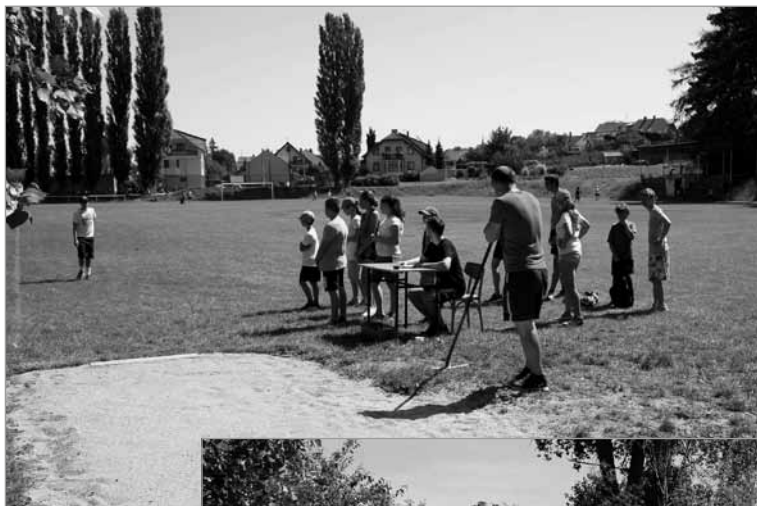
Skok daleký – příprava a provedení.