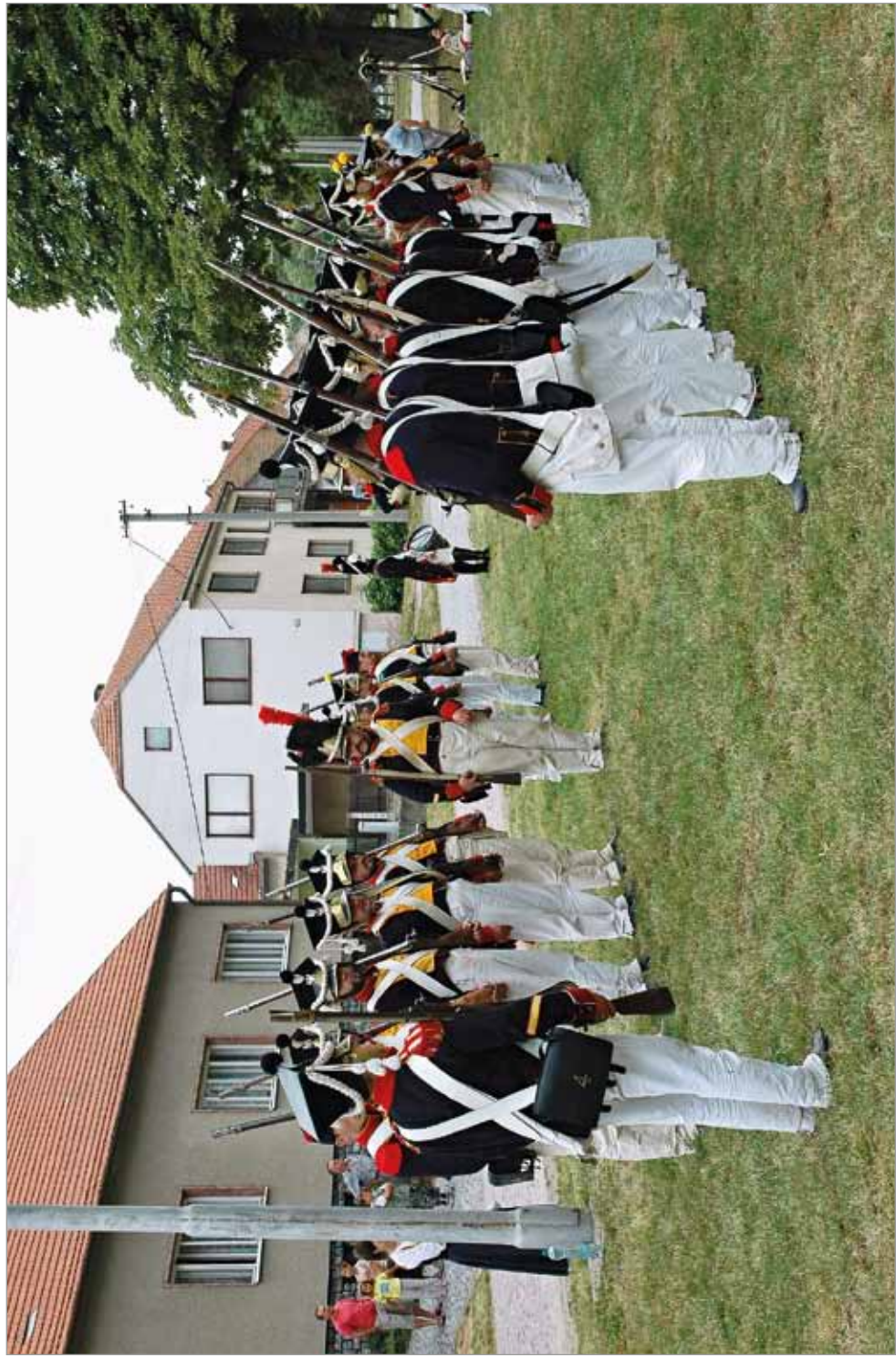
Napoleonské dny ve Tvarožné, srpen 2007