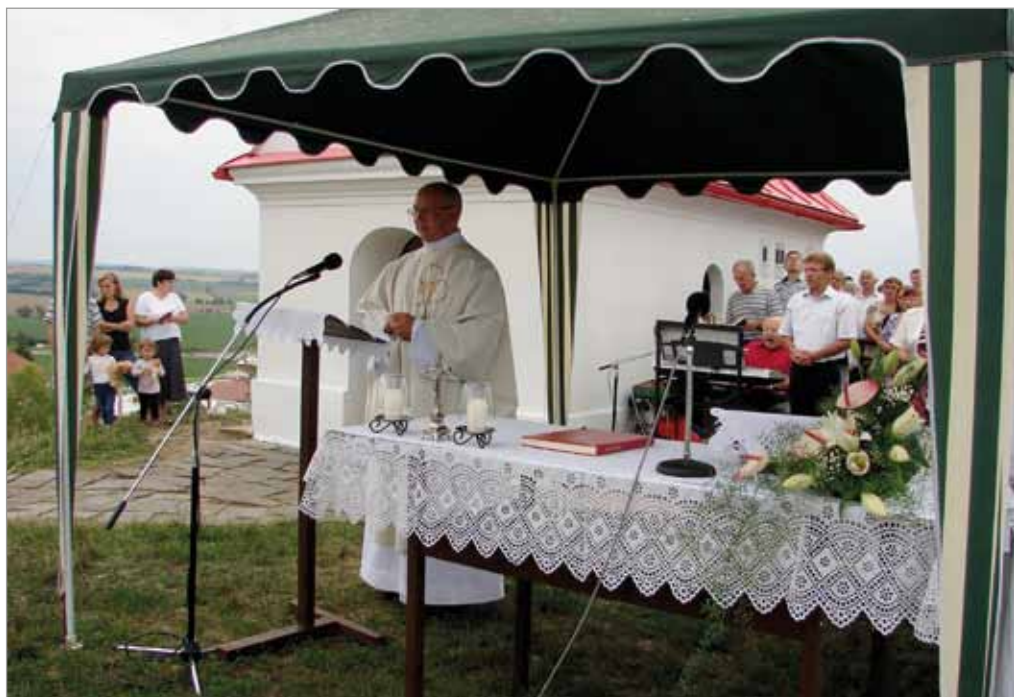
Tvaroženská pouť, 6. srpna 2017