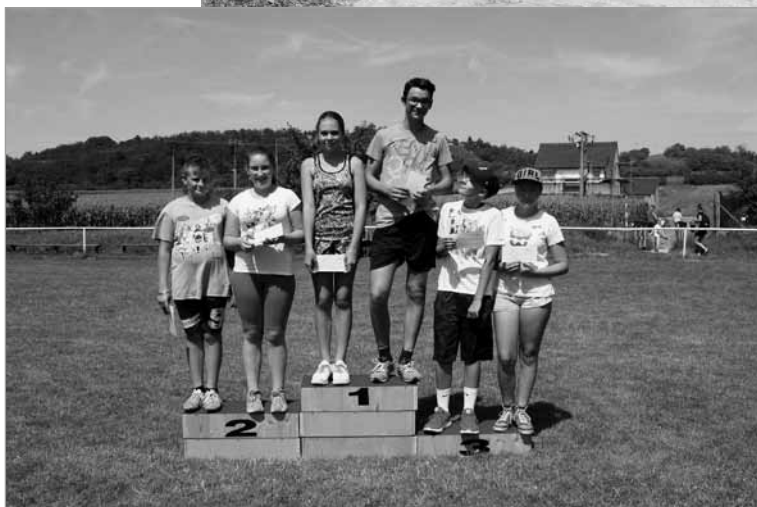
Na stupních vítězů je vždycky hezky.