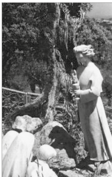
Sousoší v Sobecu, znázorňující zjevení Anděla míru a tři pasáčky

Panna Maria se dětem zjevovala na jednom vzdáleném místě zvaném Cova da Iria, kam někdy společně chodily pást ovce. Svatá Panna se jim zjevila celkem šestkrát, vždy třináctého každého měsíce. Poprvé to bylo 13. května 1917, naposledy 13. října 1917 – tehdy před 70 000 poutníky došlo k velikému slunečnímu zázraku, o kterém psaly všechny portugalské noviny a zveřejnily četné fotografie.