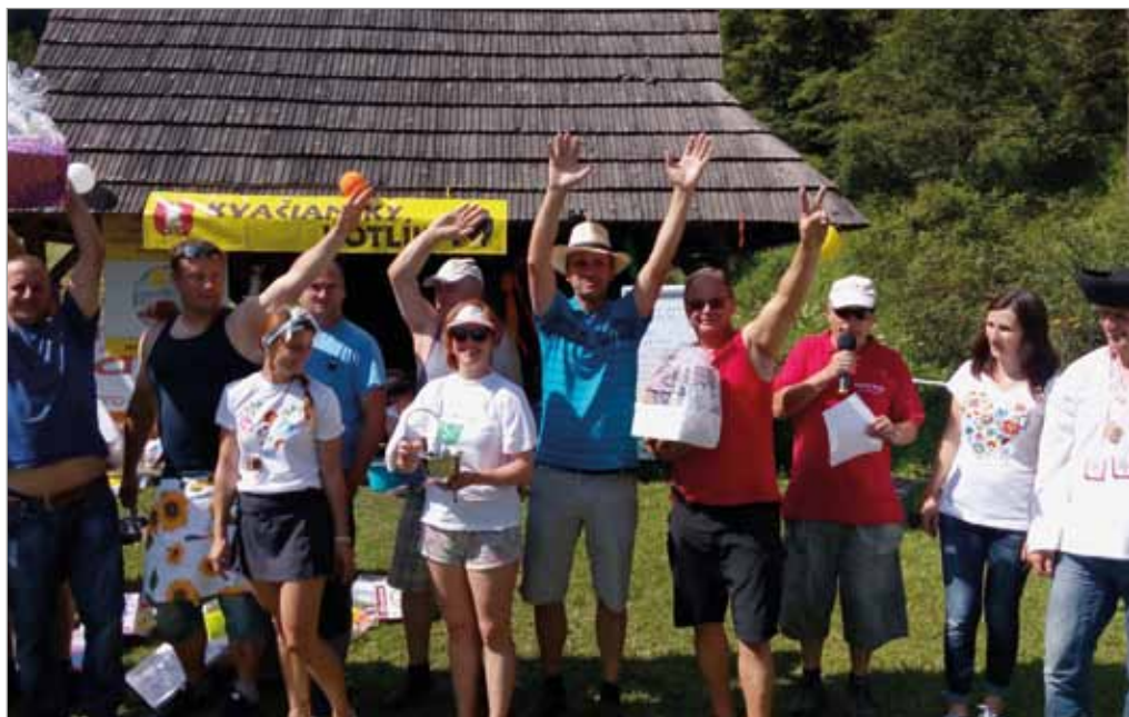
Kvačiansky kotlík, 8. července 2017