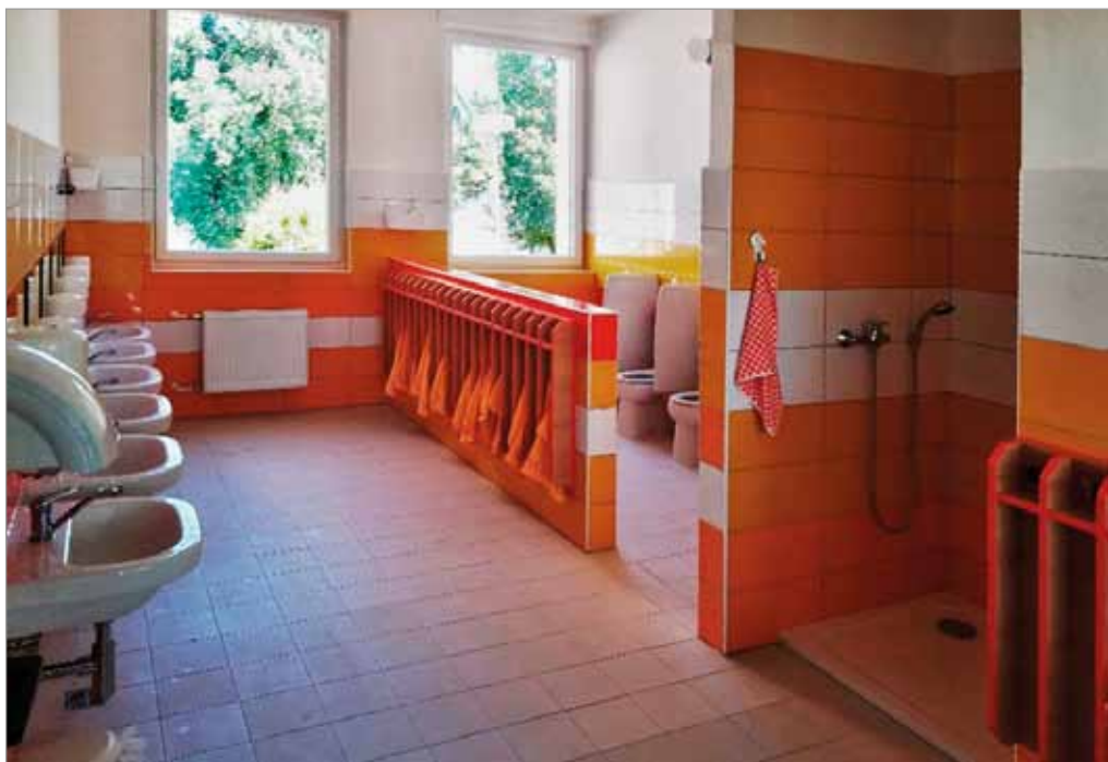
Nová umyvadla v mateřské škole, srpen 2017