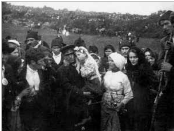
Jacinta (ozdobená) při slunečním zárazku ve Fatimě 17. října 1917

zpět k Bohu, neskloní-li se před nejvyšším Pánem a Tvůrcem, stihnou je veliké tresty, úměrné jeho provinění a vzdoru.