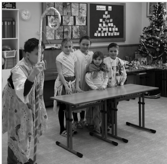
Vánoční besídka v ZŠ

Na zimní měsíce plánujeme: V termínu 10.–12. ledna lyžařský výcvik na Fajtově kopci u Velkého Meziříčí, 30. 1., 14. 2. a 20. 2. bruslení na ledové ploše za Lužánkami, sněhulákování ihned po napadení trošky sněhu, ze kterého bude možné stavět sně-