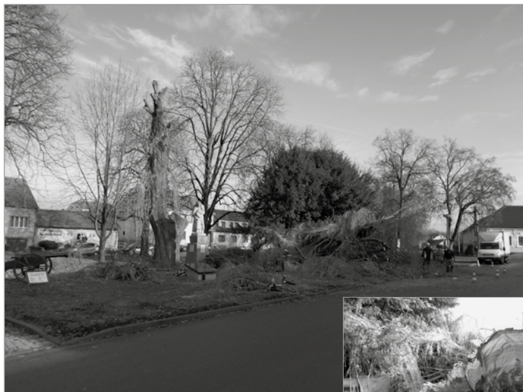
Prořezávání smuteční vrby na návsi, autor: Jiří Bajer