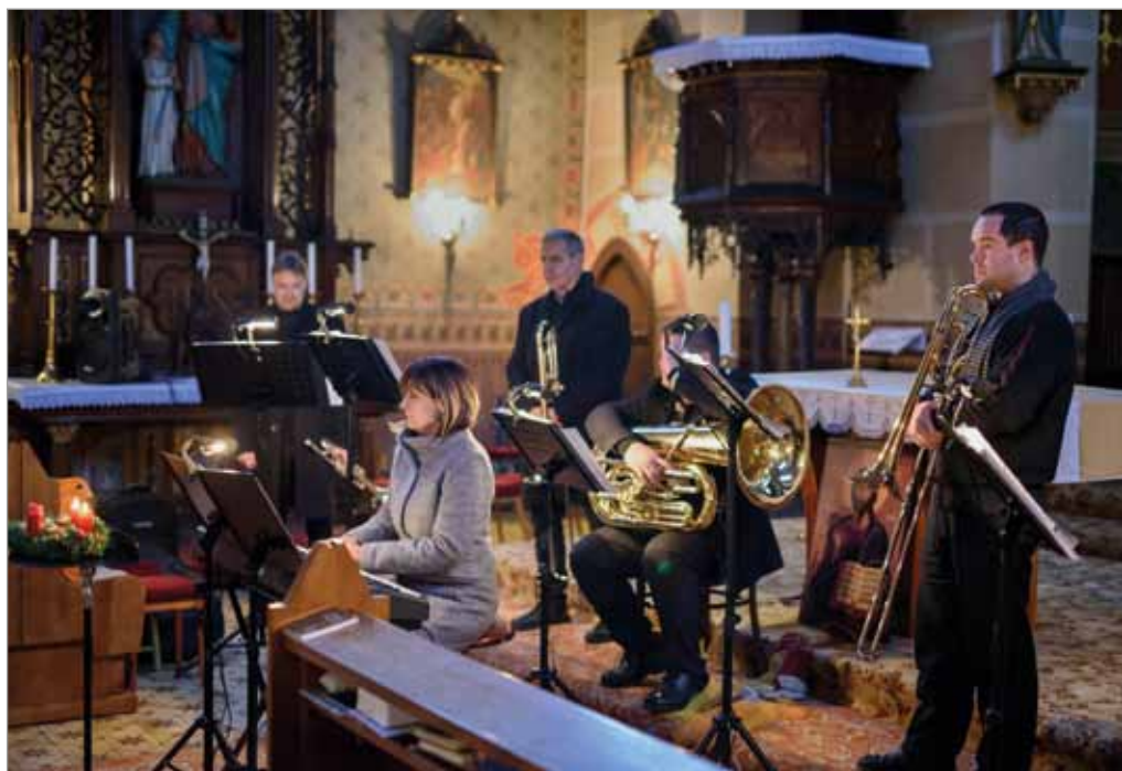
Adventní koncert, MUSICA ANIMAE, 10. prosince 2017