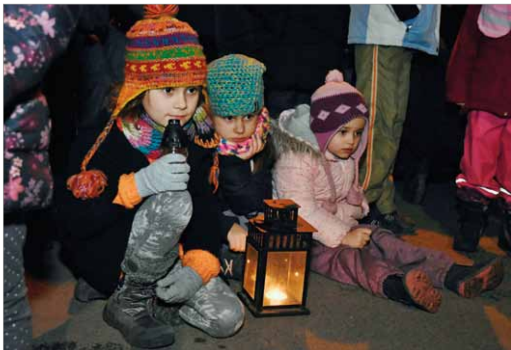
Betlémské světlo, setkání u vánočního stromu, 23. prosince 2017