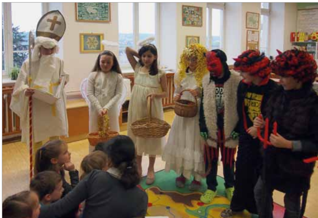
Mikulášská nadílka v ZŠ, 6. prosince 2017