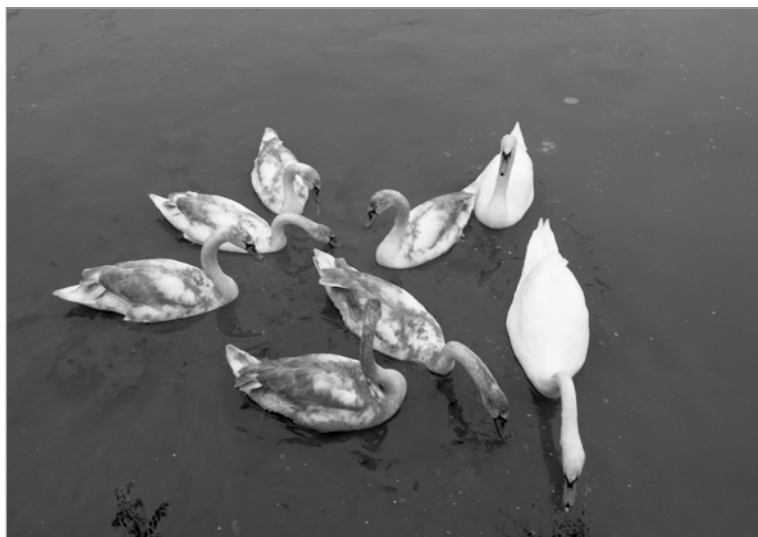
Labuť na tvaroženském rybníku