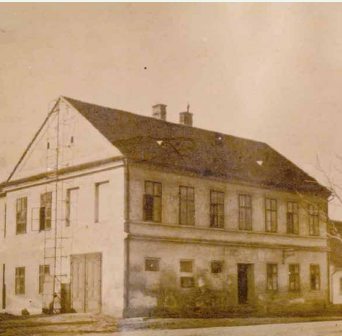
Obecní úřad, dříve budova školy (zač. 20. století).