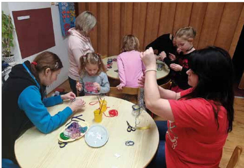
Vánoční tvoření v MŠ, 14. prosince 2017