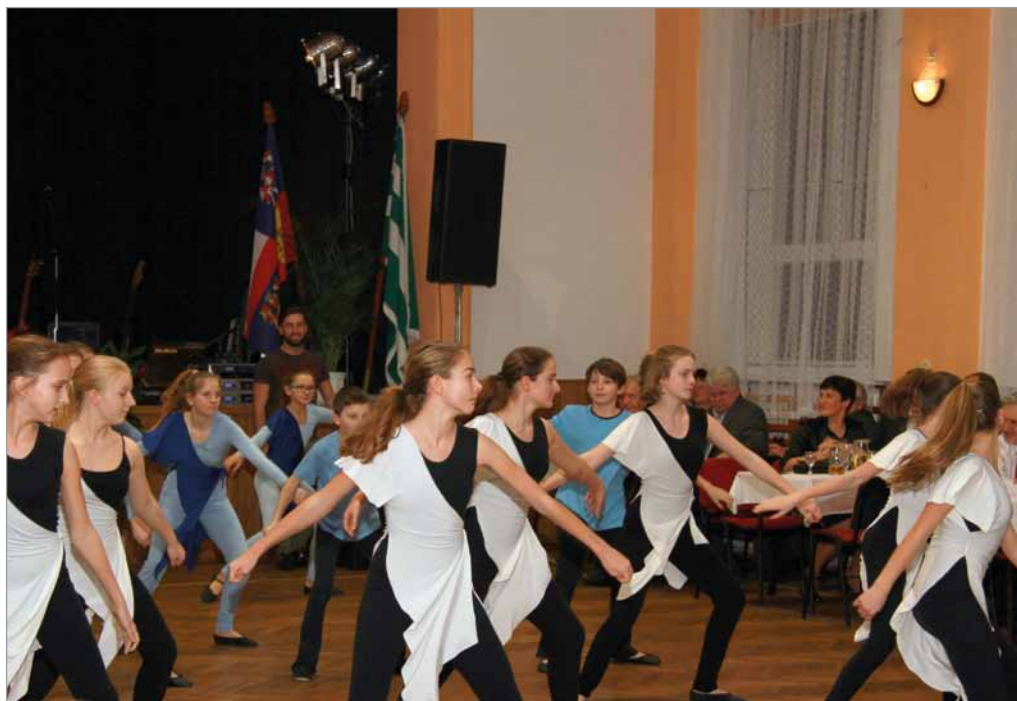
Obecní ples, 13. ledna 2018