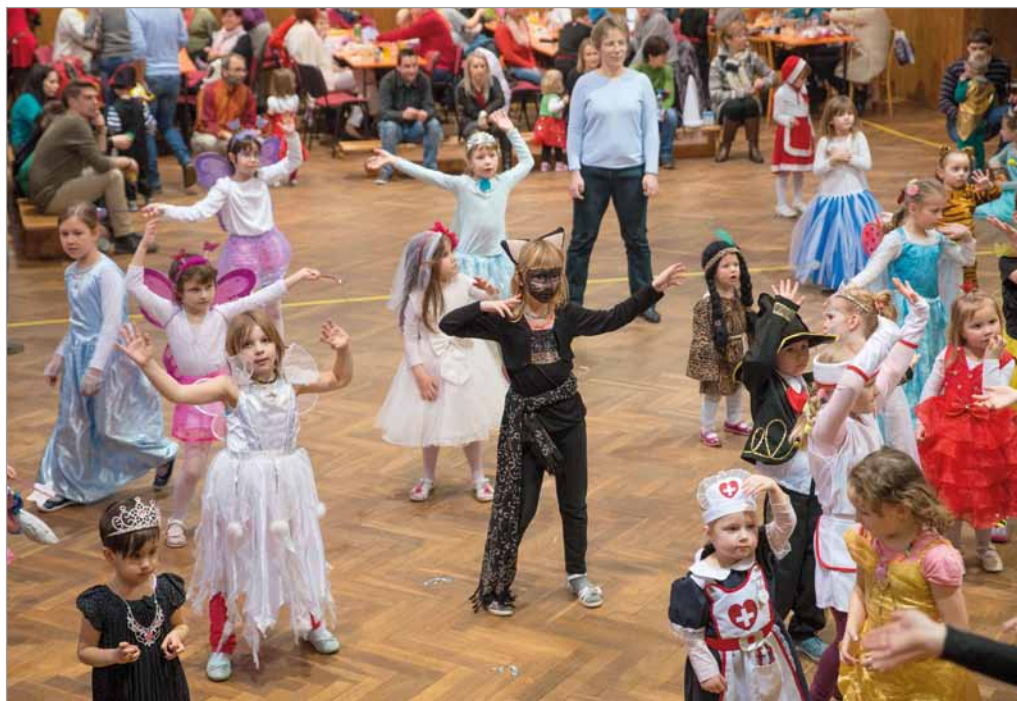
Dětský maškarní ples TJ Sokol, 28. ledna 2018