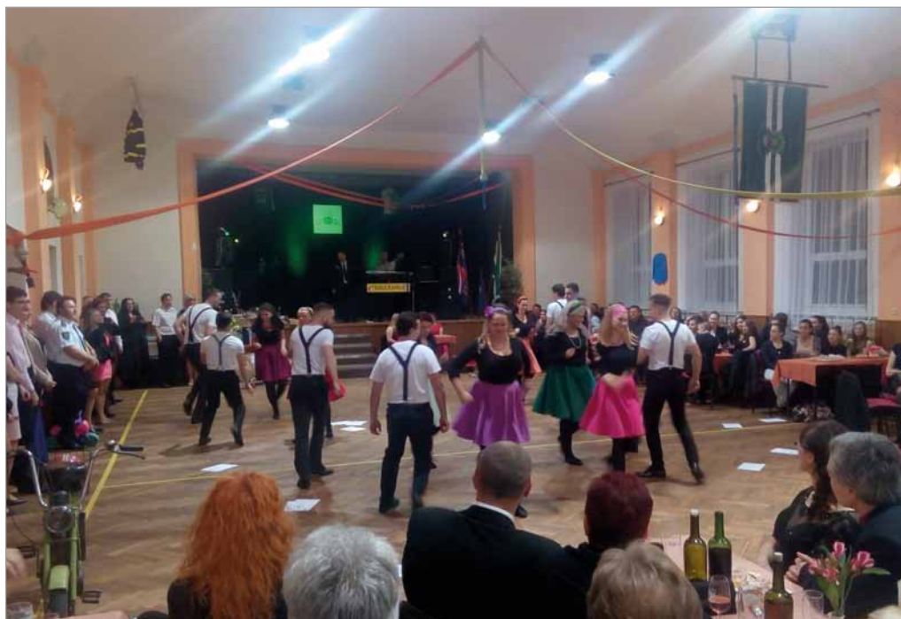
Hasičský věneček, 20. ledna 2018