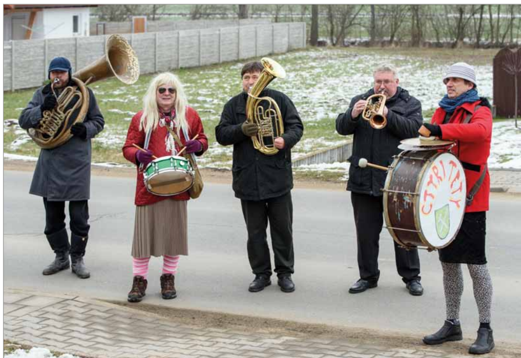
Hasičské ostatky, 10. února 2018