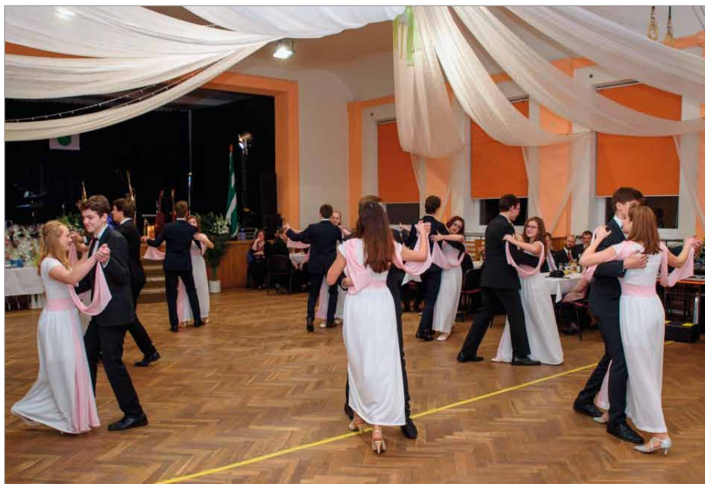
Obecní ples, 9. února 2019