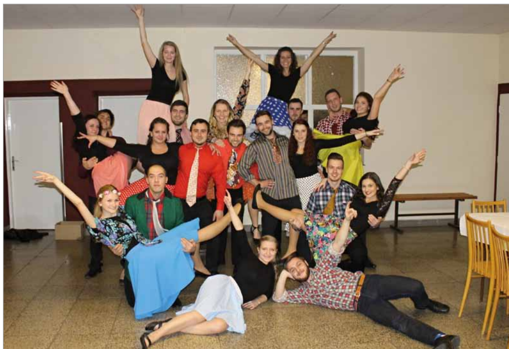
Hasičský věneček, 19. ledna 2019