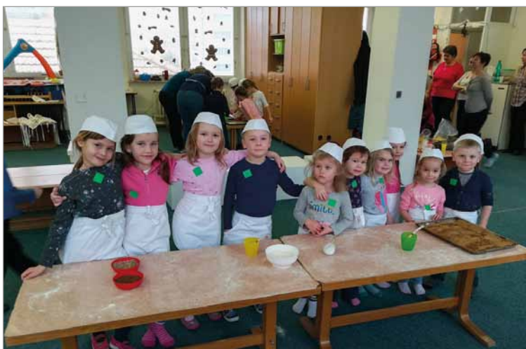
Návštěva výukového centra v Brně, kde jsme 22. února pekli chleba.