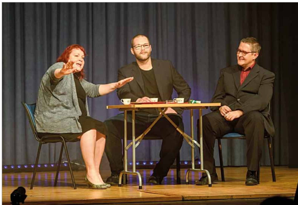
Televarieté, Divadlo Amadis, 6. ledna 2019