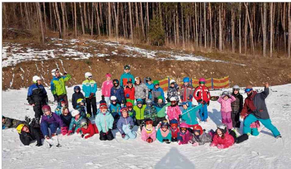
Lyžařský výcvik 2019

ověřit svoje znalosti knih se zvířecí tematikou.