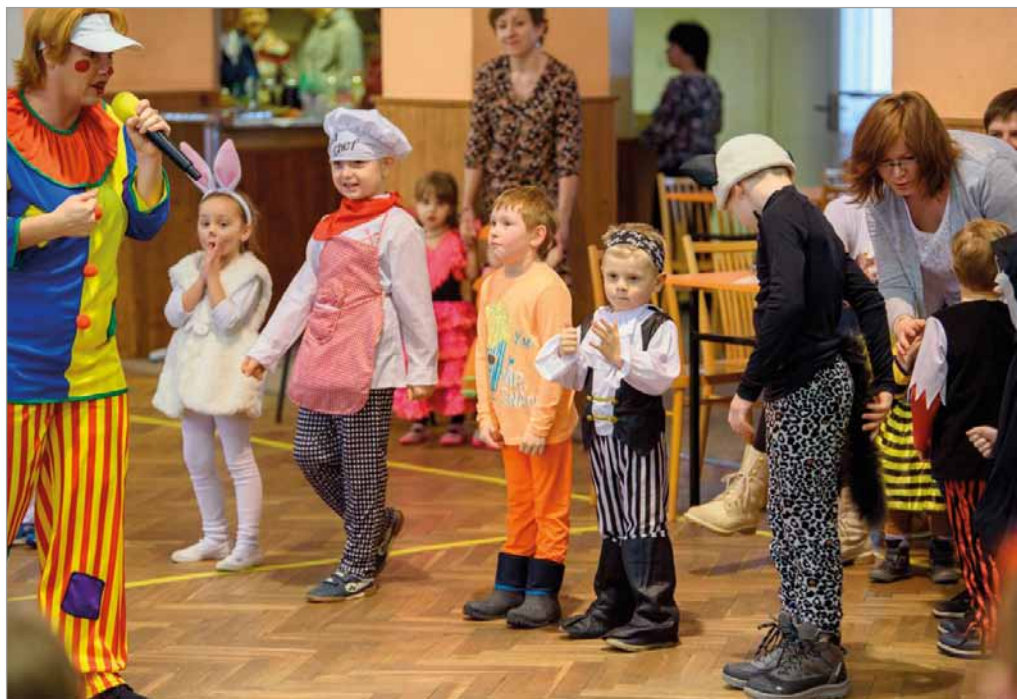
Dětský maškarní ples TJ Sokol, 26. ledna 2019