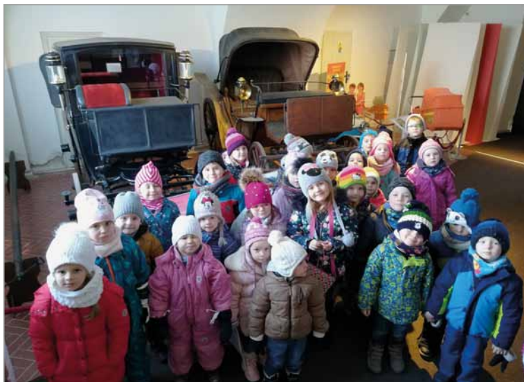
Návštěva Muzea ve Šlapanicích 7. února.

17. dubna připravujeme pro širokou veřejnost pohádku „Sněhurka a sedm trpaslíků, aneb jak to dopadlo?“ Tuto pohádku ve spojení s vystoupením dětí z anglického kroužku zahájíme v 16,00 hod. Srdečně zveme všechny na tuto kulturní akci.