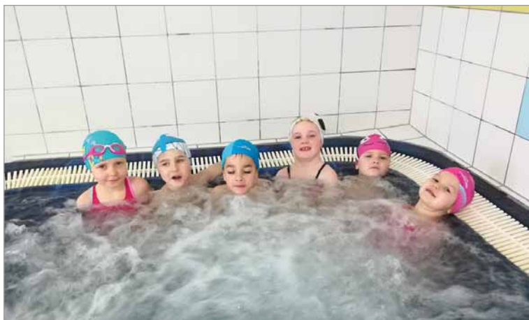
Probíhající plavání v Plavecké škole Vyškov.

23. dubna jedeme opět do Divadla Bolka Polívky na premiéru pohádky „O statečném kováři Mikešovi“, kde se kovářský synek vydá do světa na zkušenou. Bude muset překonat spoustu nástrah, ale nakonec vše dobře dopadne, tak, jak to v pohádkách bývá.