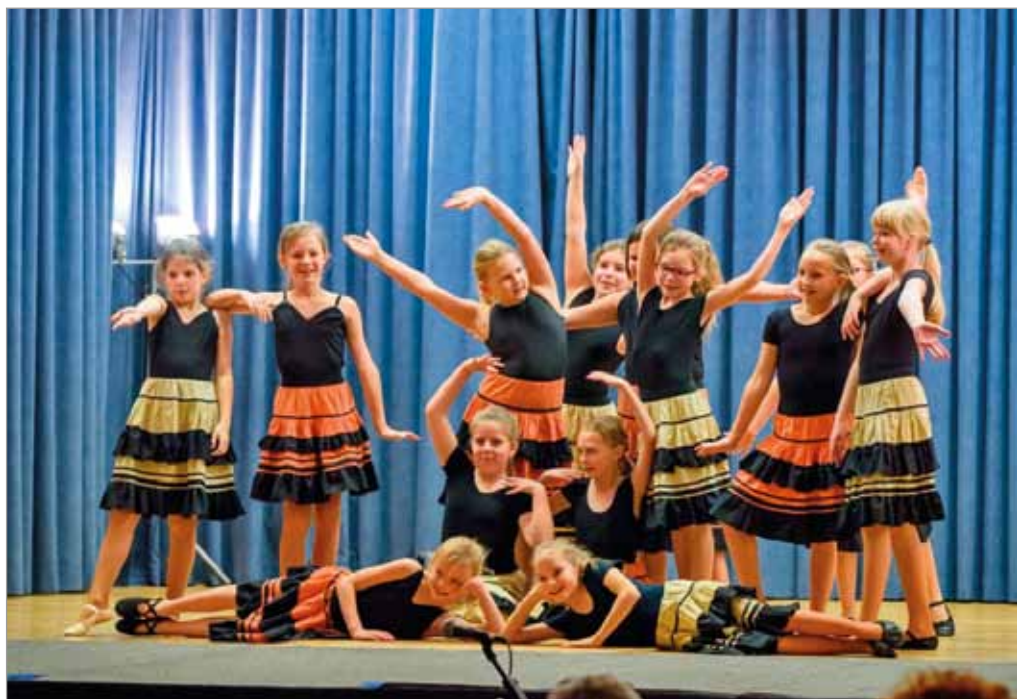
Vystoupení žáků ZUŠ Pozoříce, 16. prosince 2019