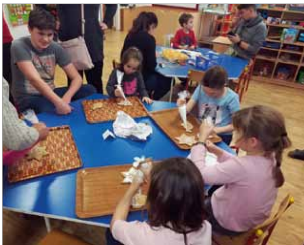
10. prosince – vánoční dílničky v MŠ

21. ledna začínají Edukativně stimulační skupiny pro děti, které zahájí školní do-