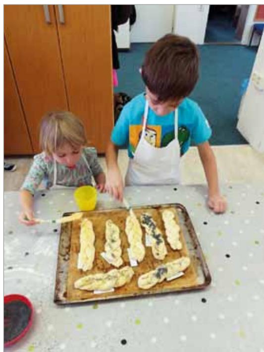
19. prosince – pečení vánoček

bál. Nebude chybět tombola, kde každé dítě vyhrává. Již dnes můžete svým dětem připravit nějaký zajímavý kostým, fantazii se meze nekladou.