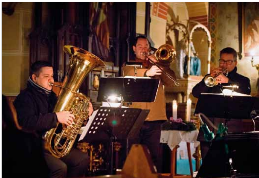
Adventní koncert Musica Anima, 15. prosince 2019