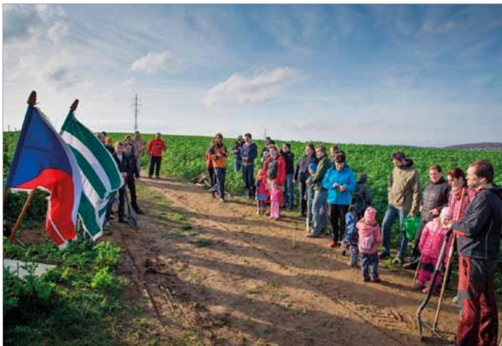
Výsadba stromů u příležitosti 30. výročí Sametové revoluce, 17. listopadu 2019