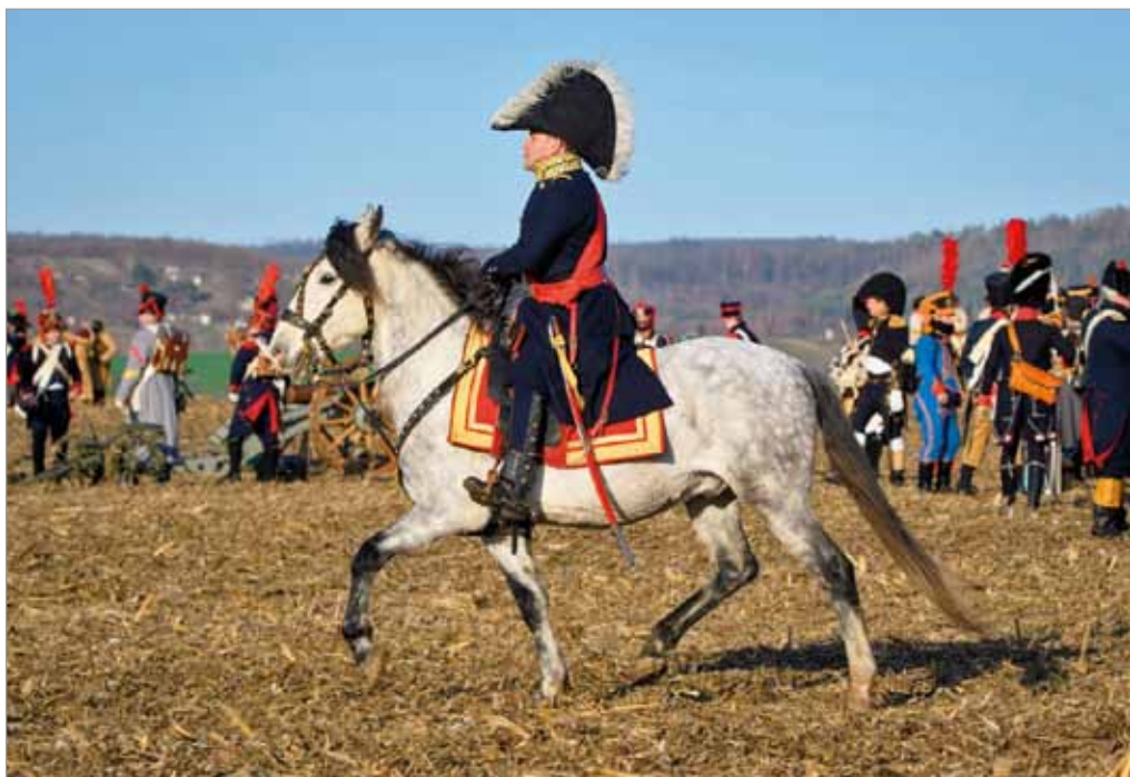
Vzpomínkové akce, 214. výročí bitvy tří císařů, 30. listopadu 2019