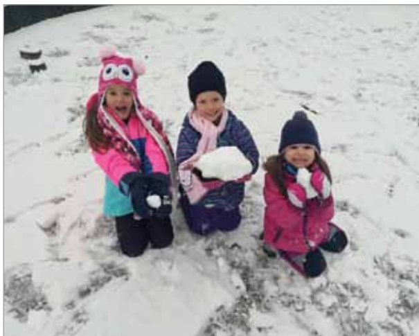
13. prosince – první nebo poslední sněž?

14. února od 9.00 hod. se bude konat tradiční maškarní