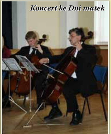
Koncert ke Dni matek