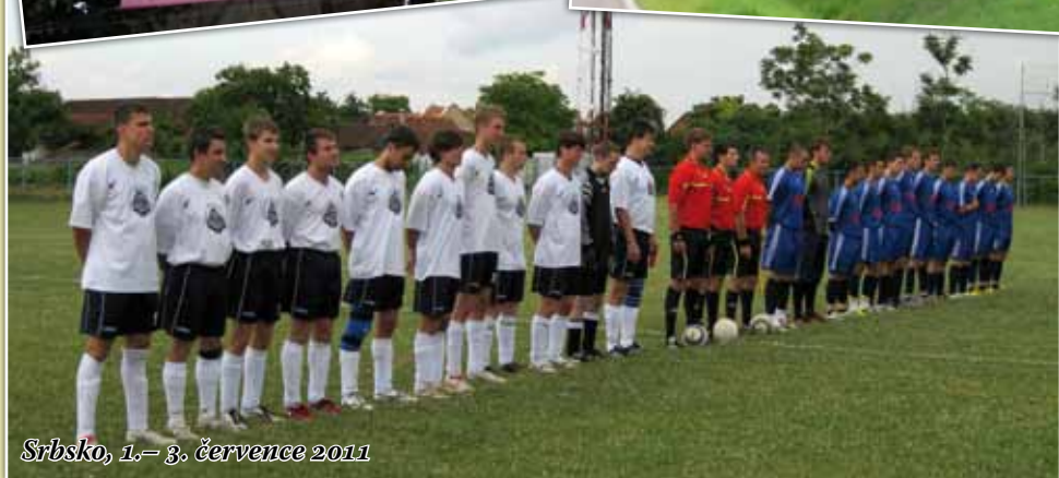
Srbsko, 1.- 3. července 2011