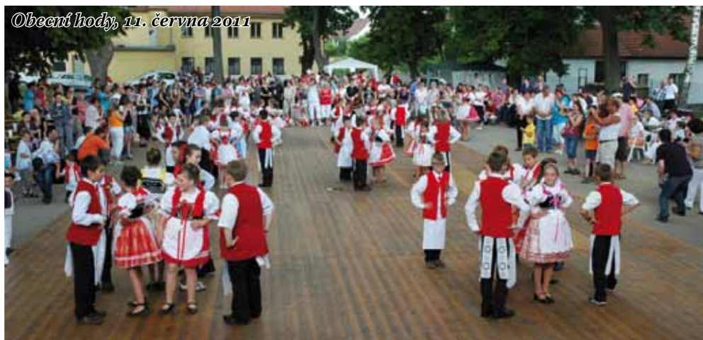
Obecní hody, 11. června 2011