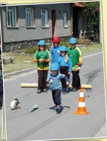
Schütze SDH – 120 let