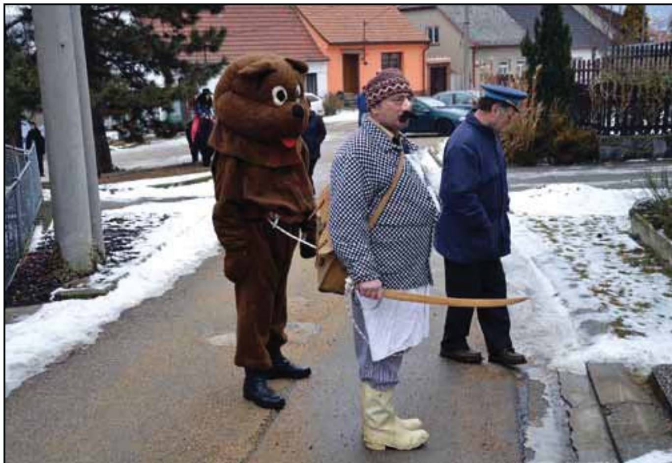
Ostatky, 18. února 2012