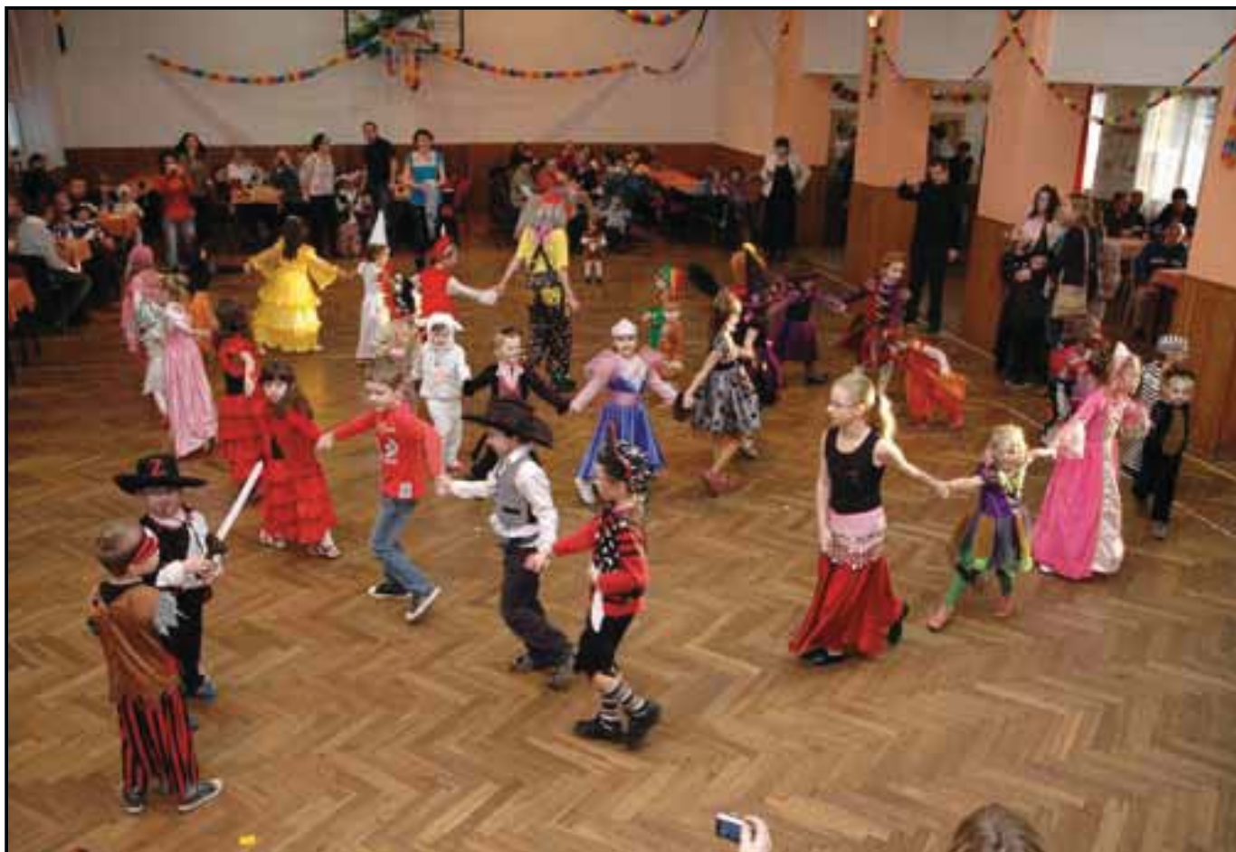
Dětský maškarní ples TJ Sokol, 15. ledna 2012