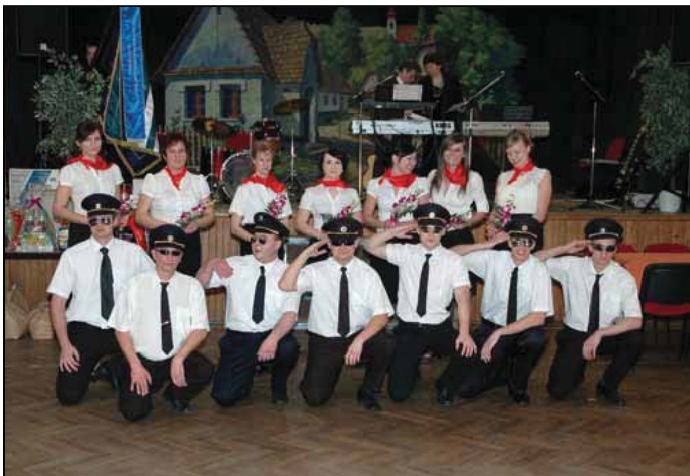
Hasičský věneček, 4. února 2012