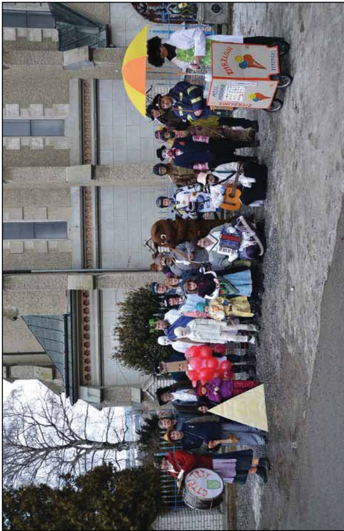
Ostatky, 18. února 2012