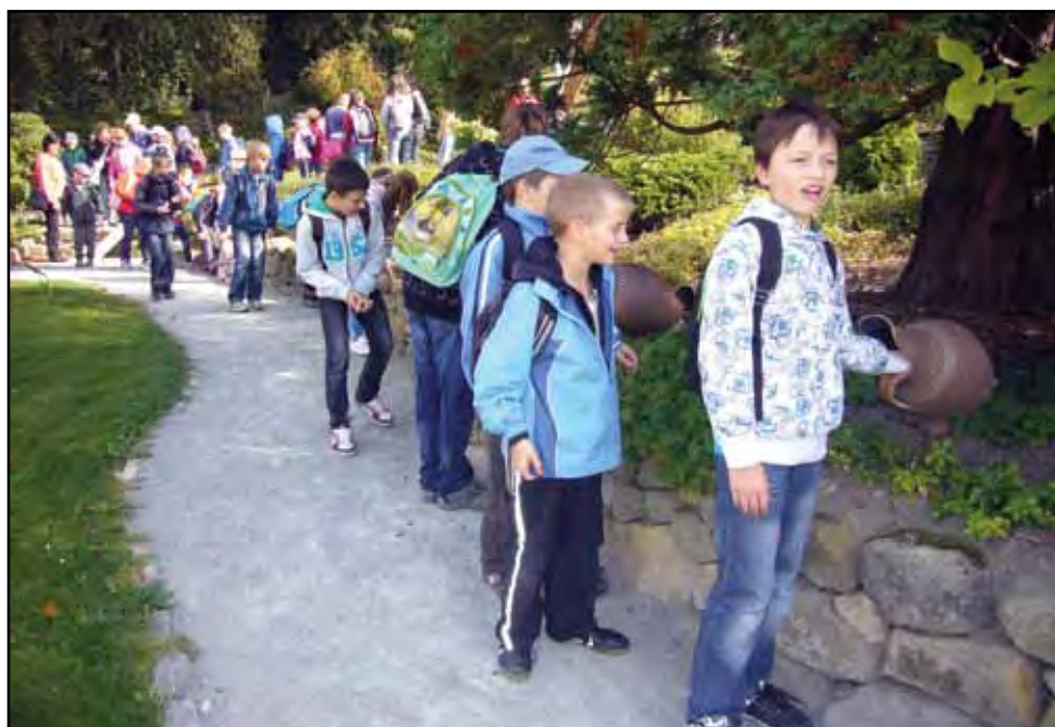
Základní škola na výletě