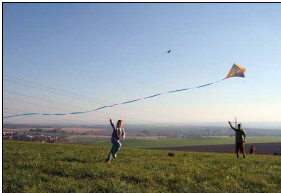
Skautská drakiáda, 20. října 2012