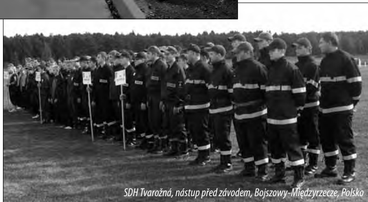
SDH Tvarožná, nástup před závodem, Bojszowy-Międzyrzecze, Polsko