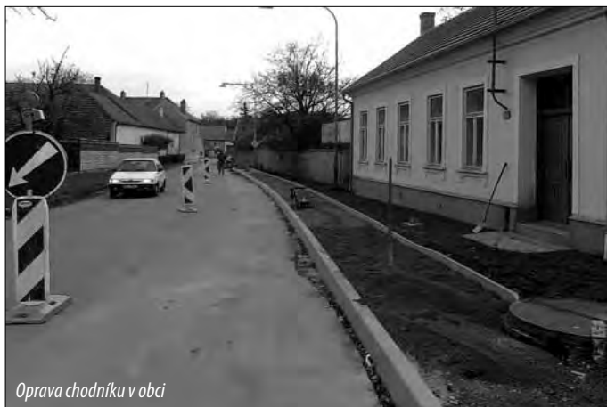
Oprava chodníku v obci