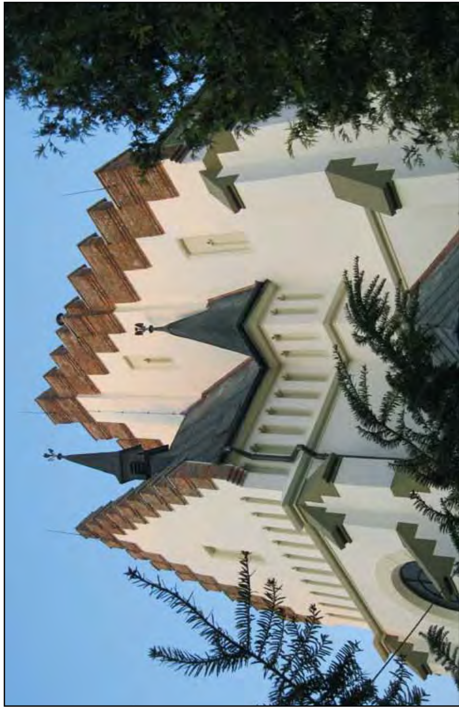
Kostel sv. Mikuláše