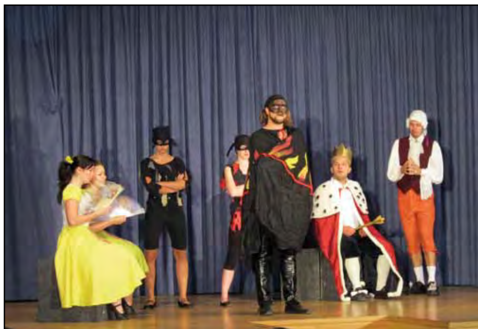
Hudební pohádka Princové jsou na draka, 23. září 2012, Sokolovna