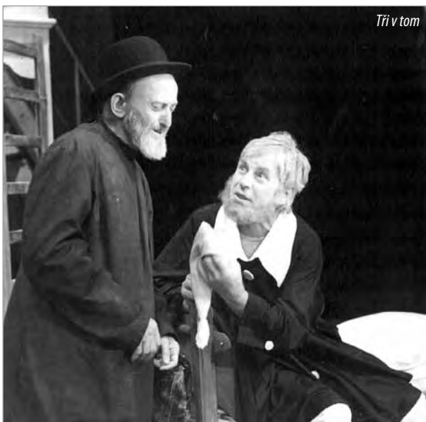
Tři v tom