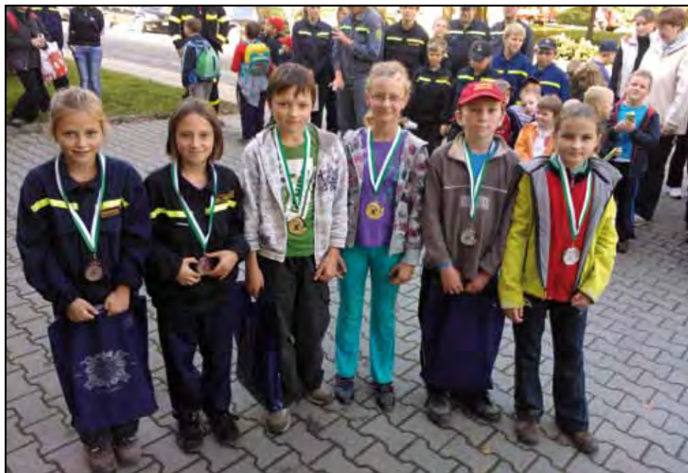
Branný závod mladých hasičů, 13. října 2012