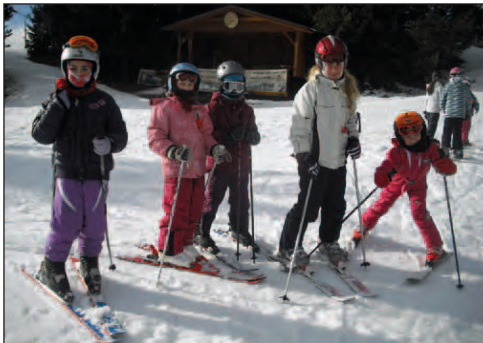
Lyžování ZŠ, 5. února 2013