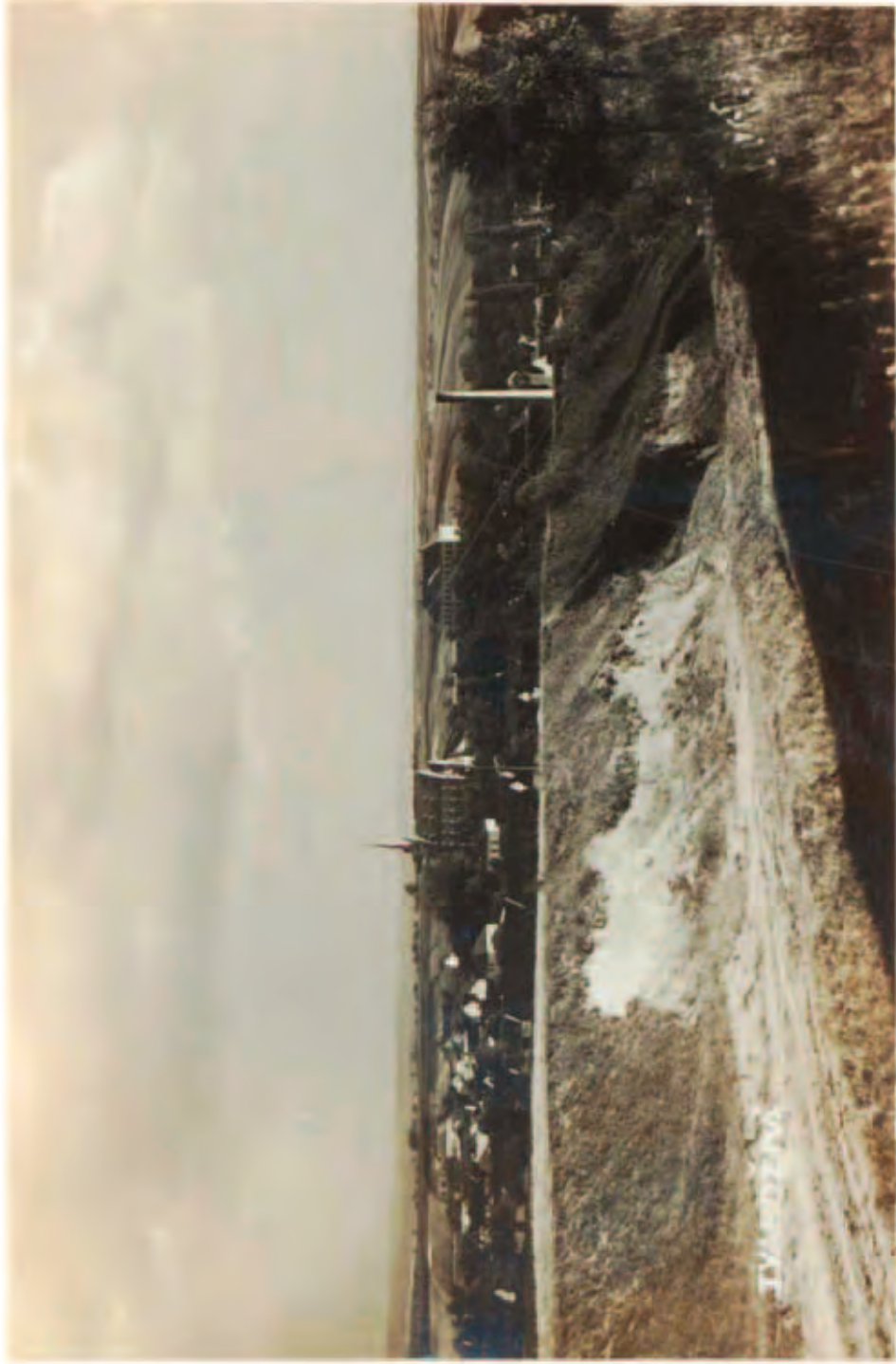
Tvarožná od severu z „Hlinek“, r. 1933