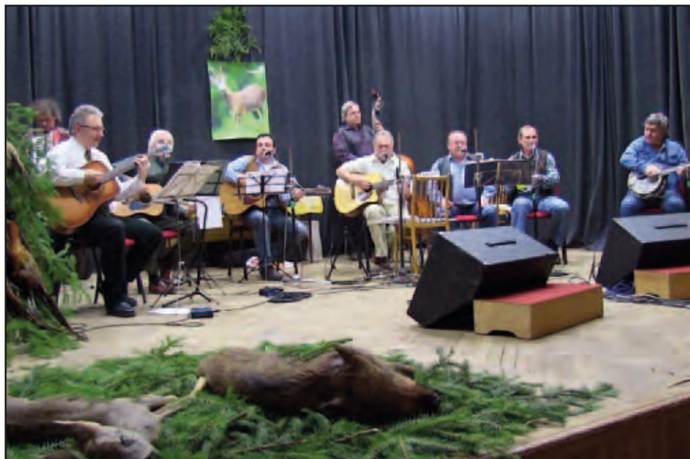
Poslední leč, 19. ledna 2013