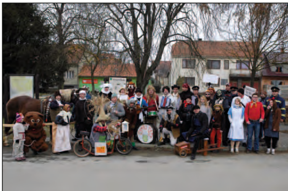
Ostatky, 9. února 2013