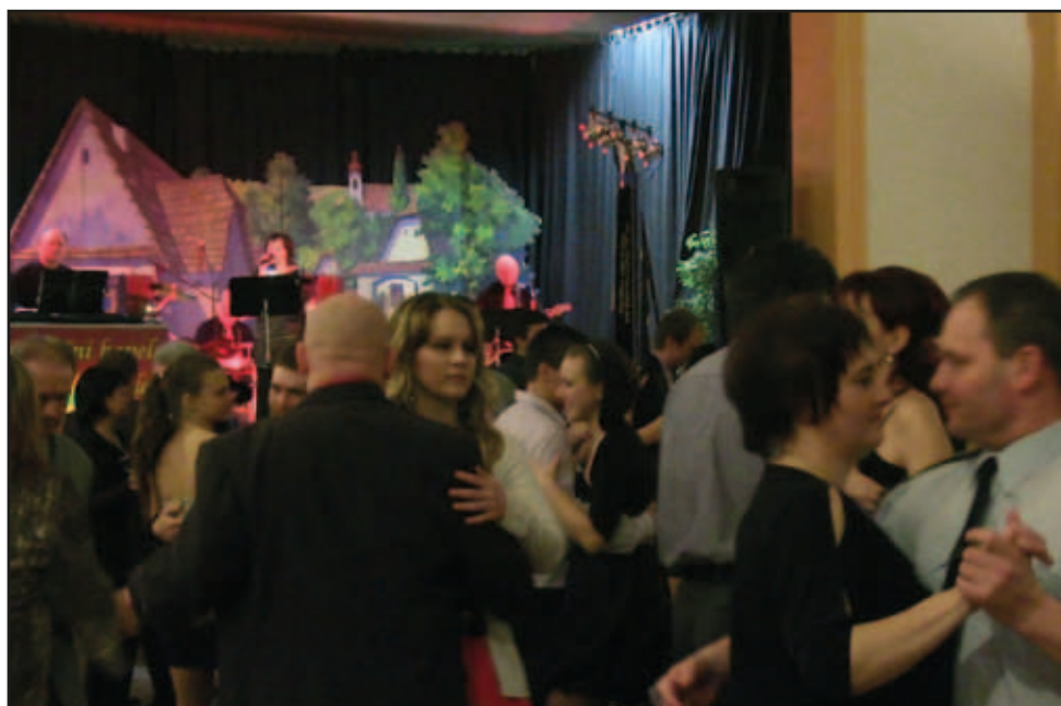
Tradiční hasičský věneček