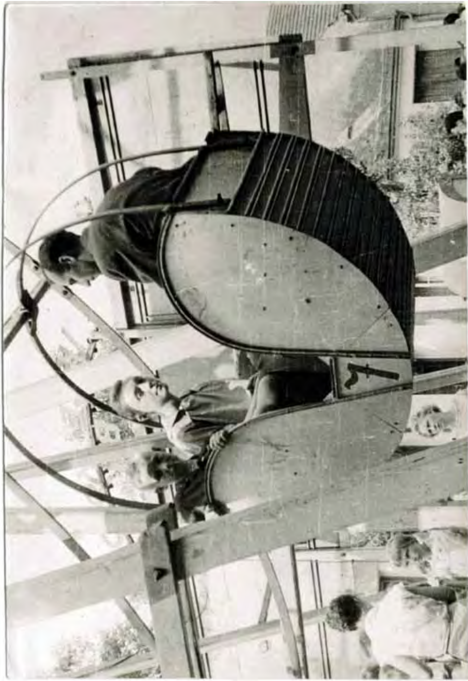
Tvaroženská pout', rok 1959