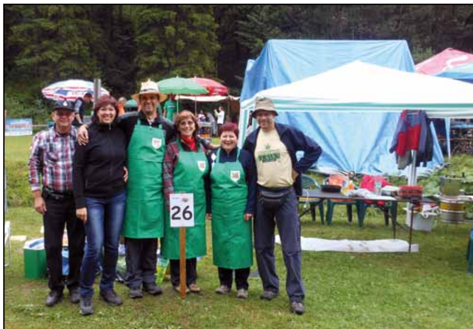
Kvačiansky kotlík, 12. července 2013 – nejlepší družstvo z Tvarožné (celkově 5. místo v soutěži)