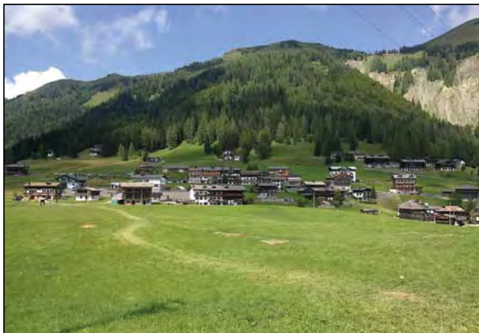
Itálie, Dolomity, Sauris di Sopra – farní dovolená, srpen 2013