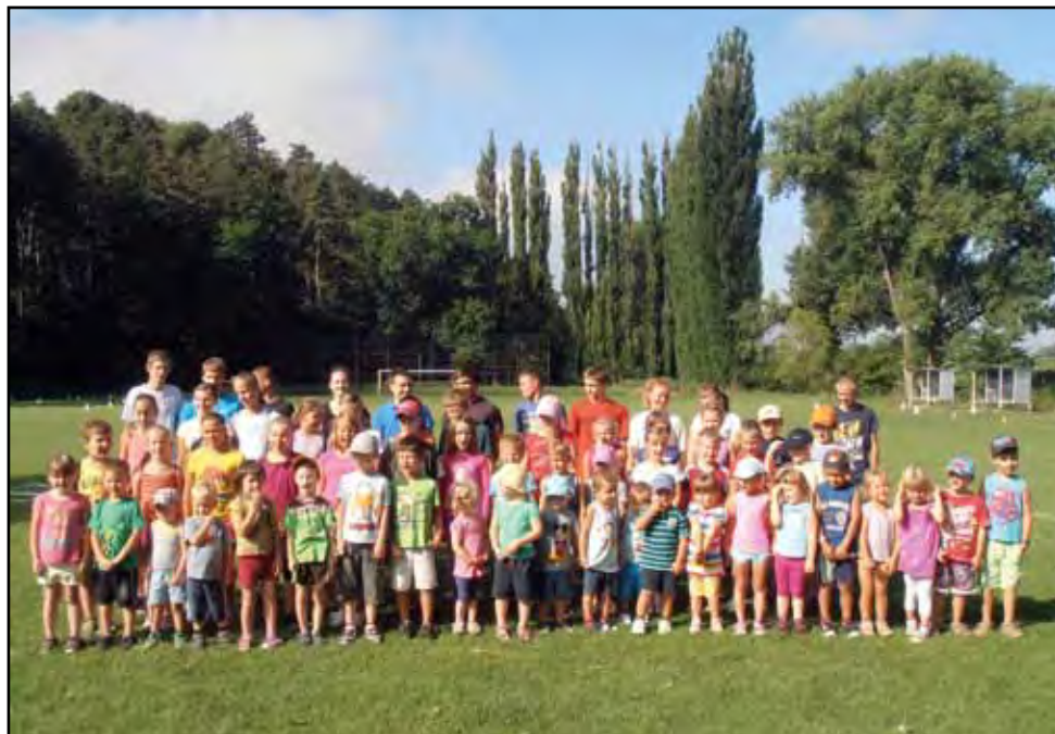
Tvaroženská olympiáda, XVII. ročník, 5. srpna 2013