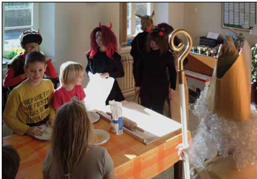
Mikuláš v Základní škole, 6. prosince 2013