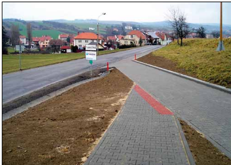
Chodník k Rohlece, I. etapa