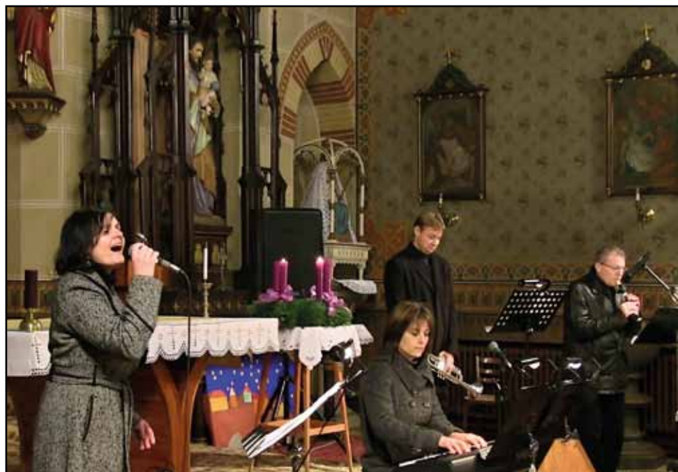
Adventní koncert v kostele sv. Mikuláše, 8. prosince 2013