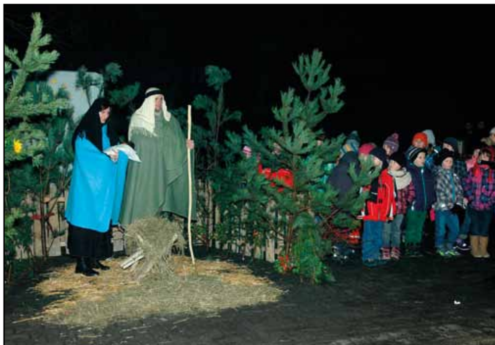
Setkání u vánočního stromu, 23. prosince 2013