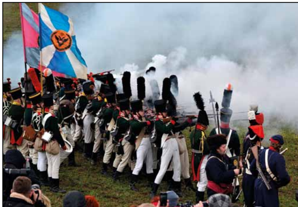
Rekonstrukce bitvy tří císařů, 30. listopadu 2013