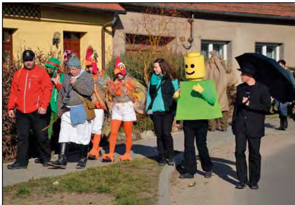
Hasičské ostatky, 1. března 2014