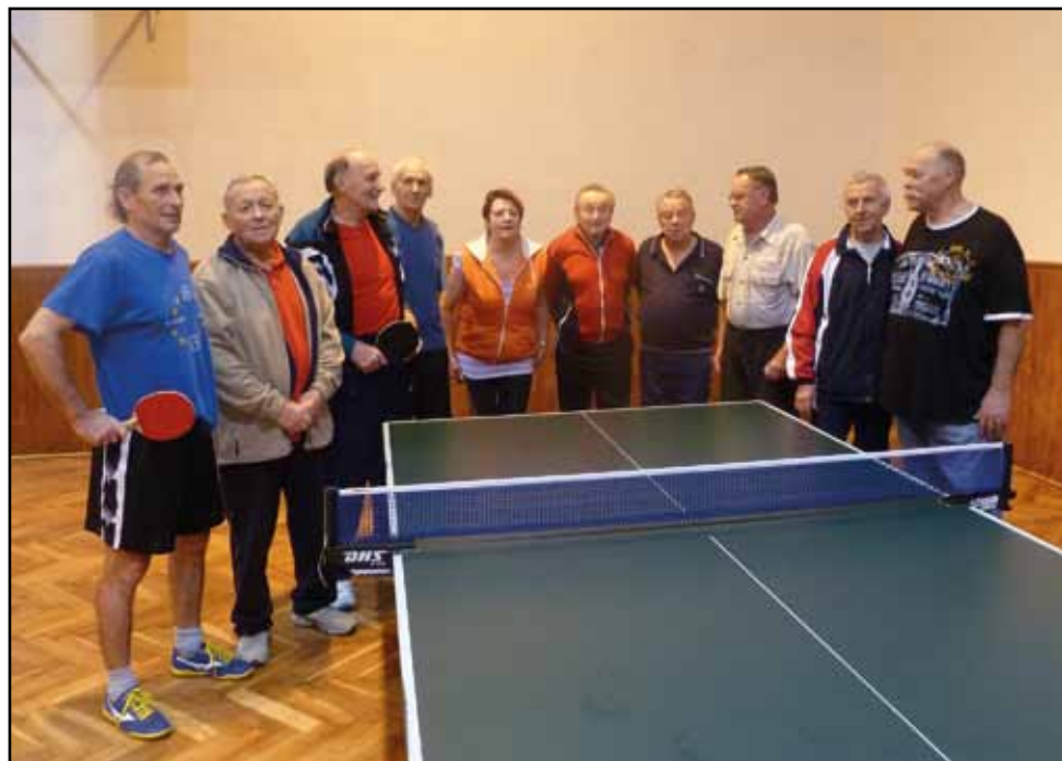
Turnaj ve stolním tenise, 30. prosince 2013