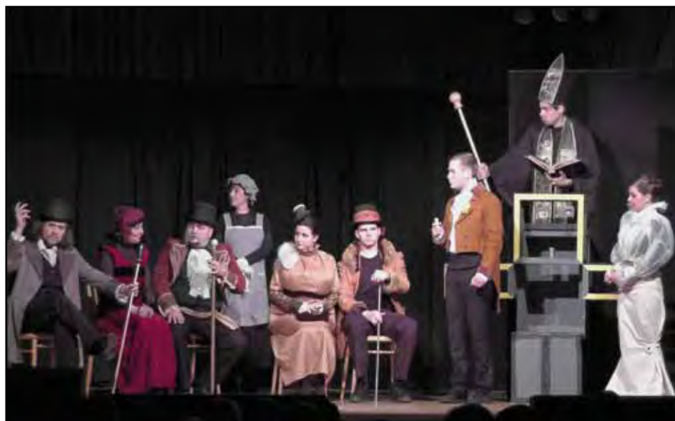
Divadlo Stodola, Nemrtvá nevěsta, 22. února 2014