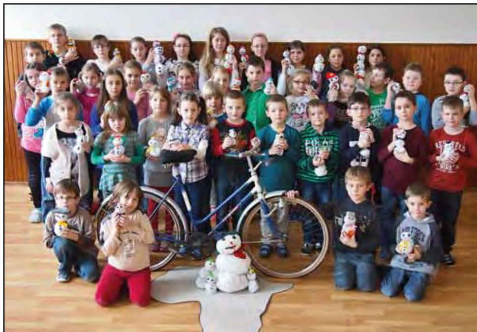
Sněhulákování v ZŠ Tvarožná, 7. března 2014