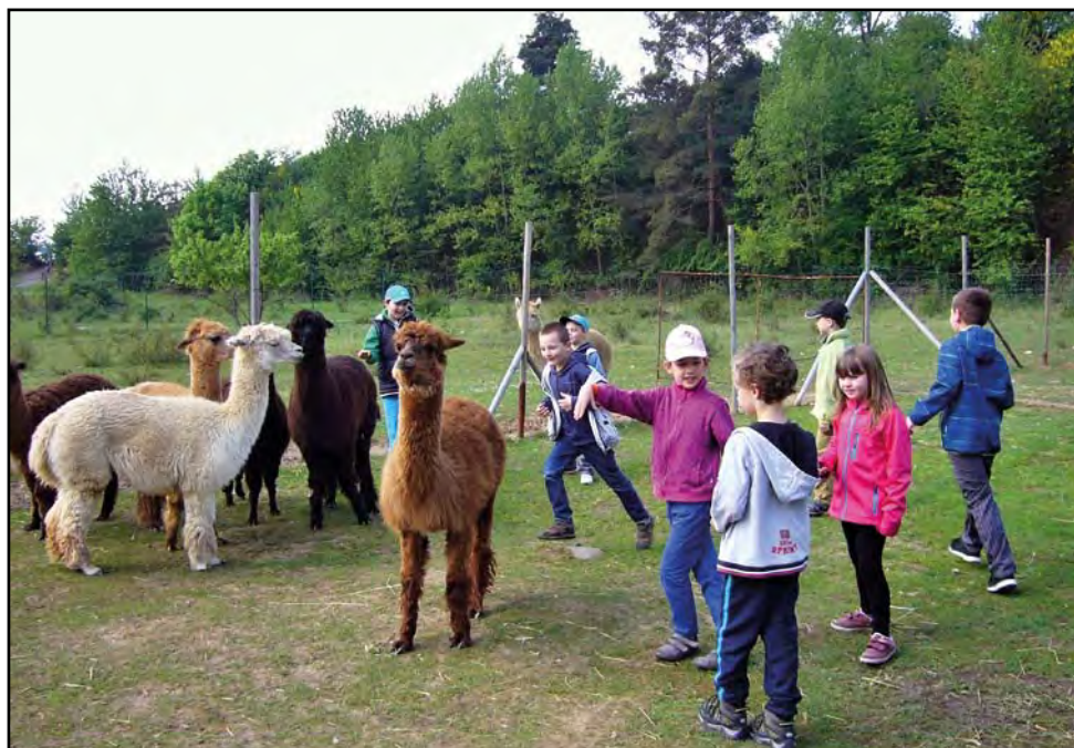
Výlet ZŠ do Lamacentra, 28. dubna 2014