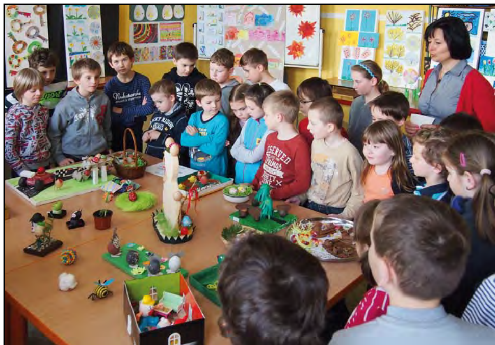
Velikonoční výstava v ZŠ, 16. dubna 2014