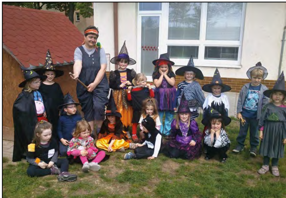
„Čarodějnice“ v mateřské škole, 29. dubna 2014