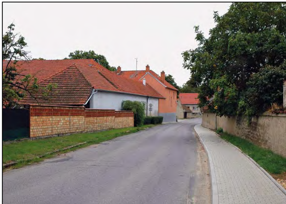
Chodník v obci