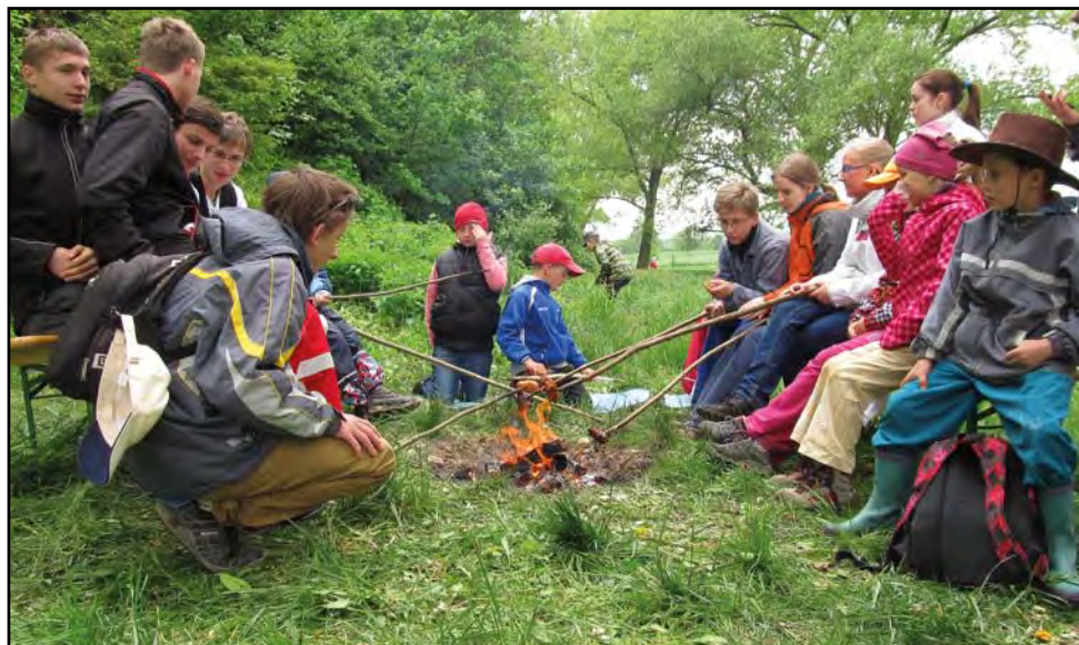
Šprýmiáda, 3. května 2014