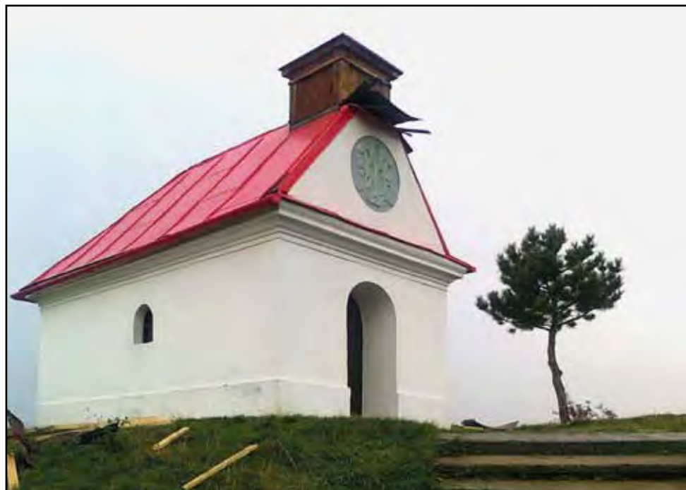
Kaple Panny Marie Sněžné na Santonu