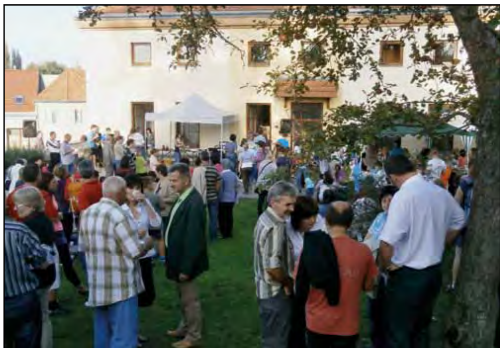
Farní den, 12. října 2014