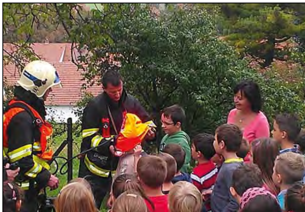
Požární cvičení v základní škole, 29. září 2014