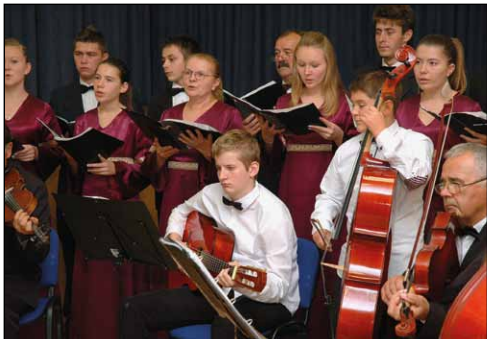
Koncert srbského komorního souboru Zvony, 6. října 2014