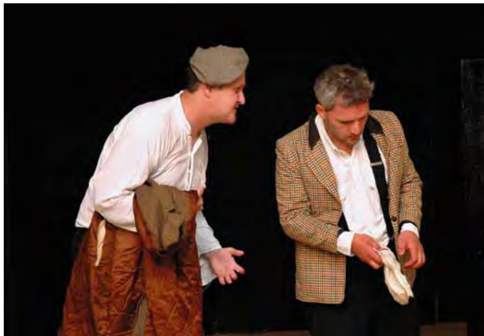
Divadelní víkend, 18.–21. září 2014