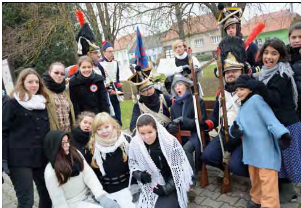
Divadelní představení Tvaroženské legendy, 29. listopadu 2014