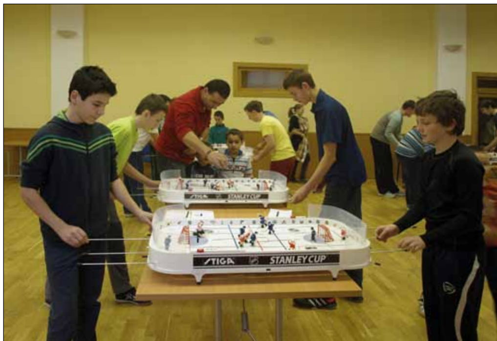
Mikulášský turnaj ve stolním hokeji, 6. prosince 2014