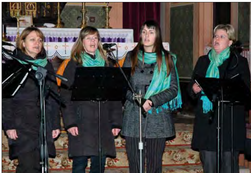
Adventní koncert v kostele sv. Mikuláše, komorní soubor Danielis, 7. prosince 2014