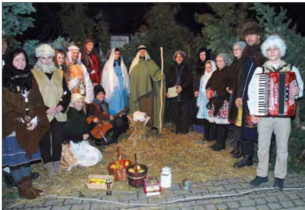
Živý betlém, 23. prosince 2014