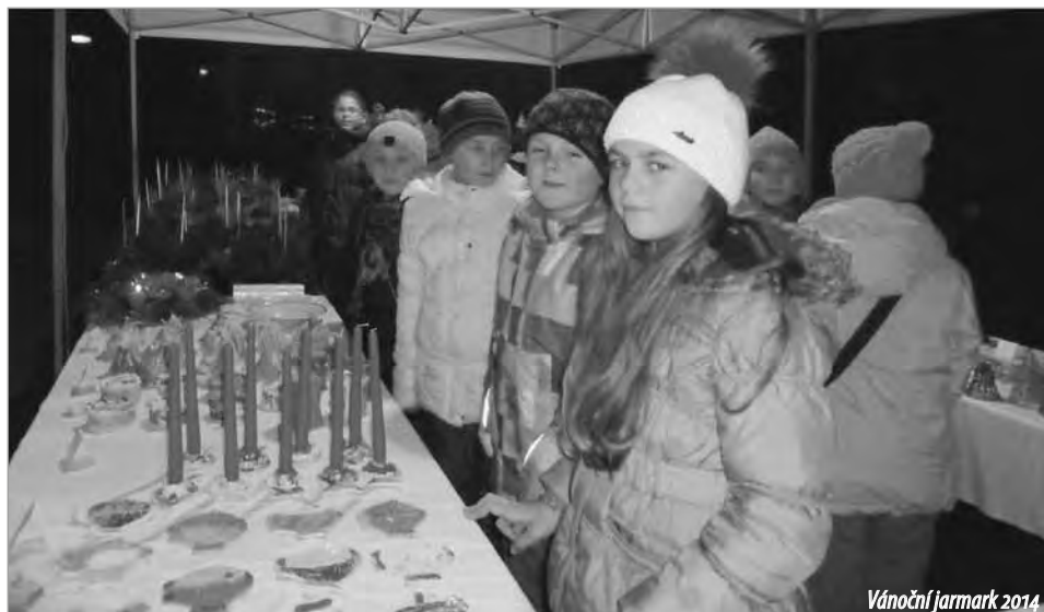
Vánoční jarmark 2014

dále bezproblémově fungovat. Na našich webových stránkách také najdete článek „Co by měl umět budoucí prvňáček“. Tento dokument vychází z doporučení MŠMT.