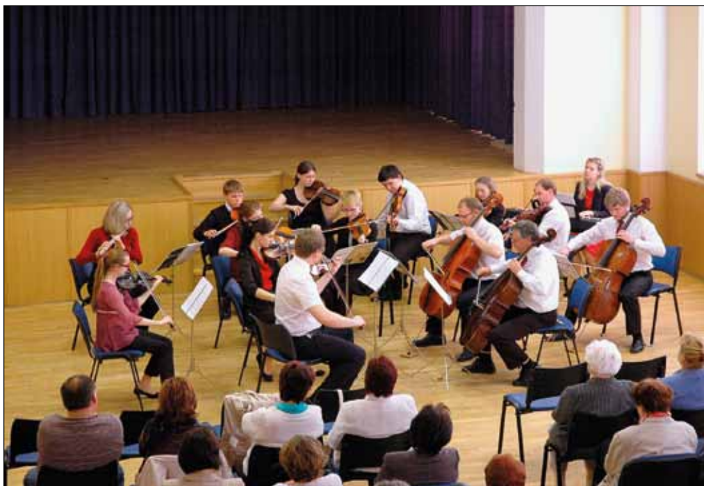
Koncert ke Dni matek, Kyjovský komorní orchestr, 10. května 2015