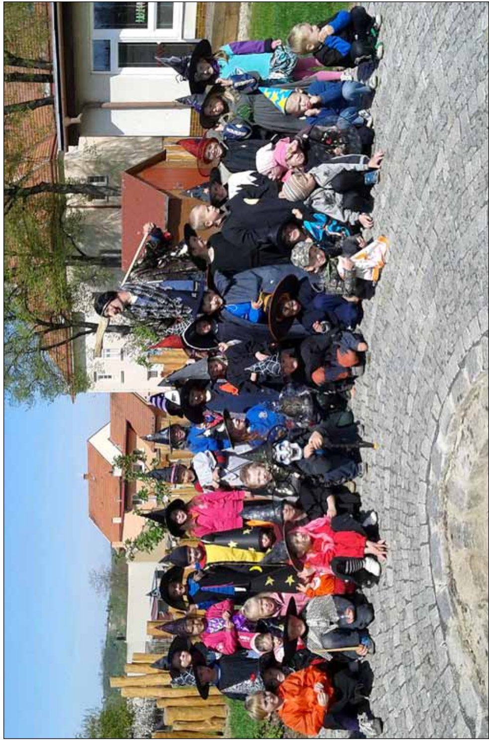
Čarodějnice v mateřské škole, 29. dubna 2015