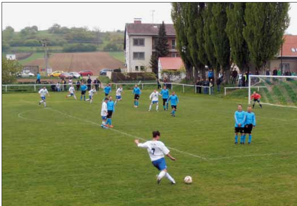
Fotbalové utkání TJ Sokol Tvarožná – SK Šlapanice B, 3. května 2015