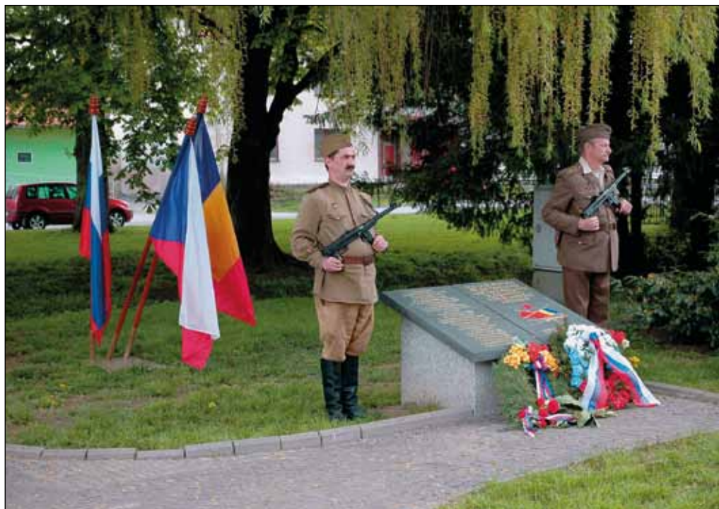
Pietní akt při příležitosti 70. výročí osvobození obce, 26. dubna 2015