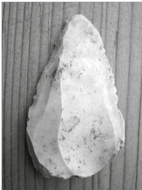
Levalloiský hrot technokomplexu bohuničieny vyrobený z limnosilicitu nalezený na lokalitě Tvarožná X – Za Školou.

V případě vašeho zájmu o pravěkou archeologii jsme schopni odpovědět