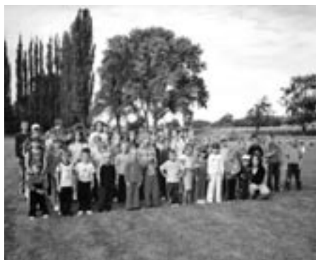
11. ročník Tvaroženské olympiády – letní část