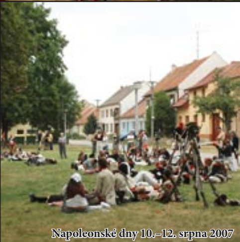
Napoleonské dny 10.-12. srpna 2007