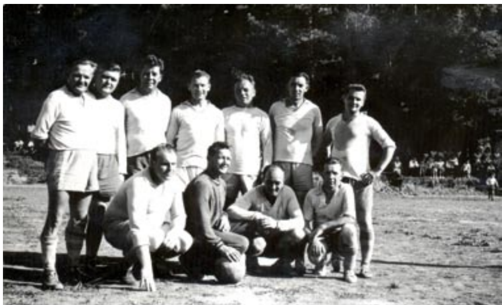
20 let oddílu kopané 10. 8. 1963 Tvarožná – Blažovice 1 : 3