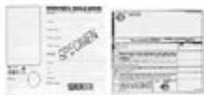
ŘP vydány v období: 1992-1993