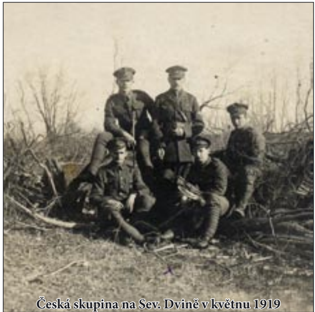
Česká skupina na Sev. Dvině v květnu 1919