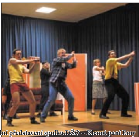
Divadelní představení spolku DŽO – Klenot paní Emmy