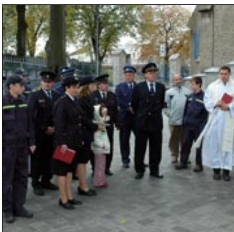
Žehnání hasičského auta