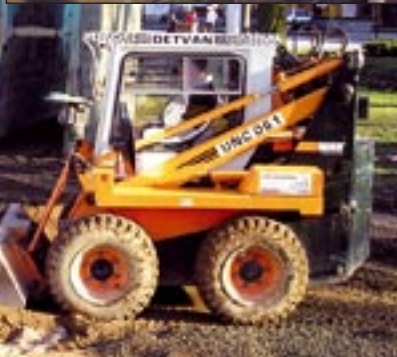
Výstavba splaškové kanalizace