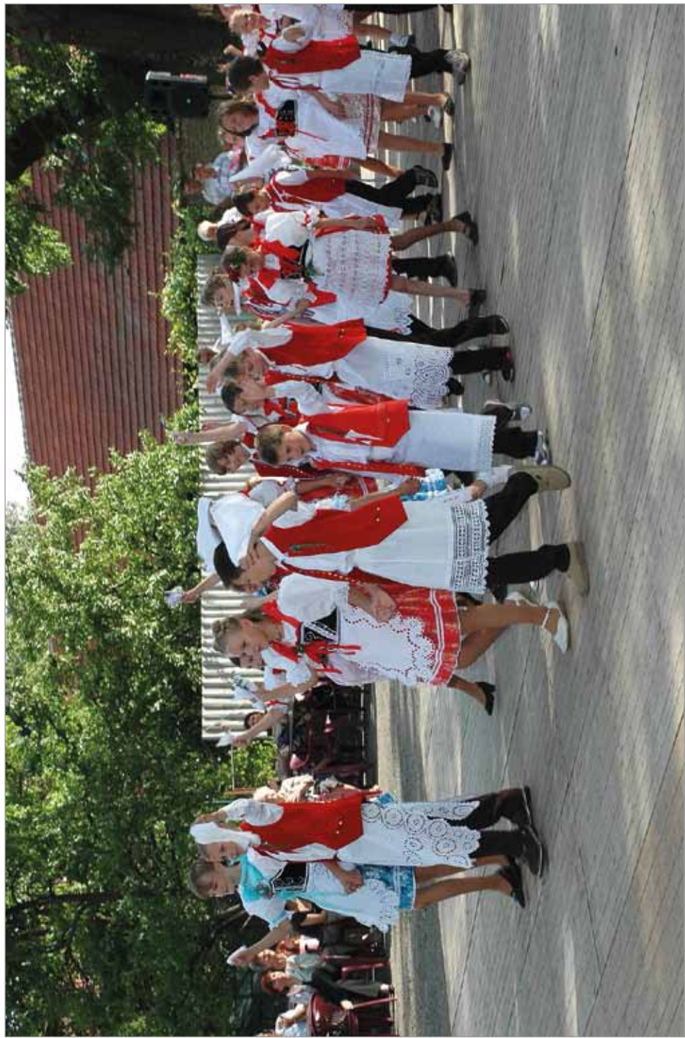
Hody, rok 2007