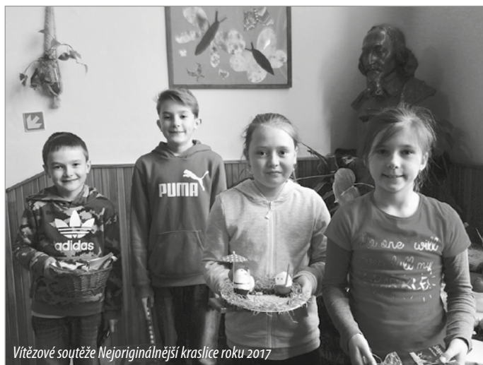
Vítězové soutěže Nejoriginálnější kraslice roku 2017

Před každými Velikonocemi pořádáme výtvarnou soutěž Nejoriginálnější kraslice