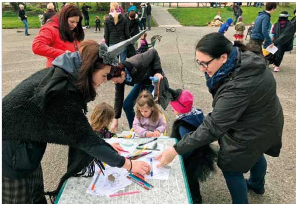
Čarodějnický rej na Kosmáku, 30. dubna 2017