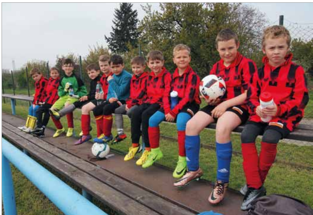
Tým ZŠ Tvarožná – McDonald's Cup, Modřice, 3. května 2017