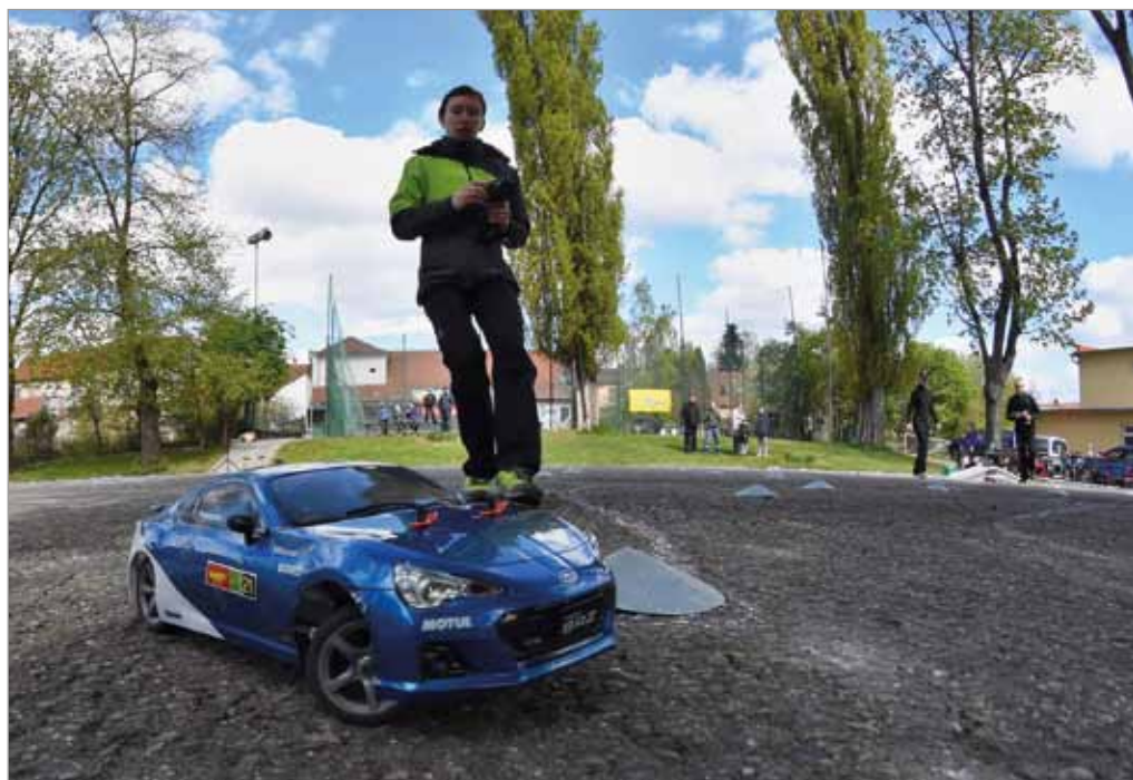
Závody RC modelů, 23. dubna 2017