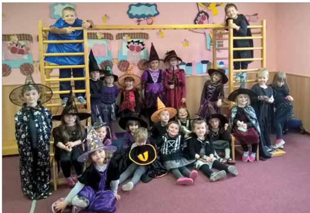
Čarodějnice v MŠ, 28. dubna 2017