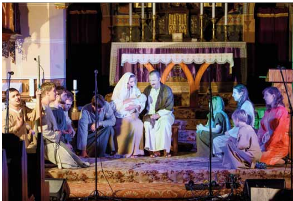
Muzikál Jesus Christ Supermlád, divadelní soubor Spojené farnosti, 16. prosince 2018