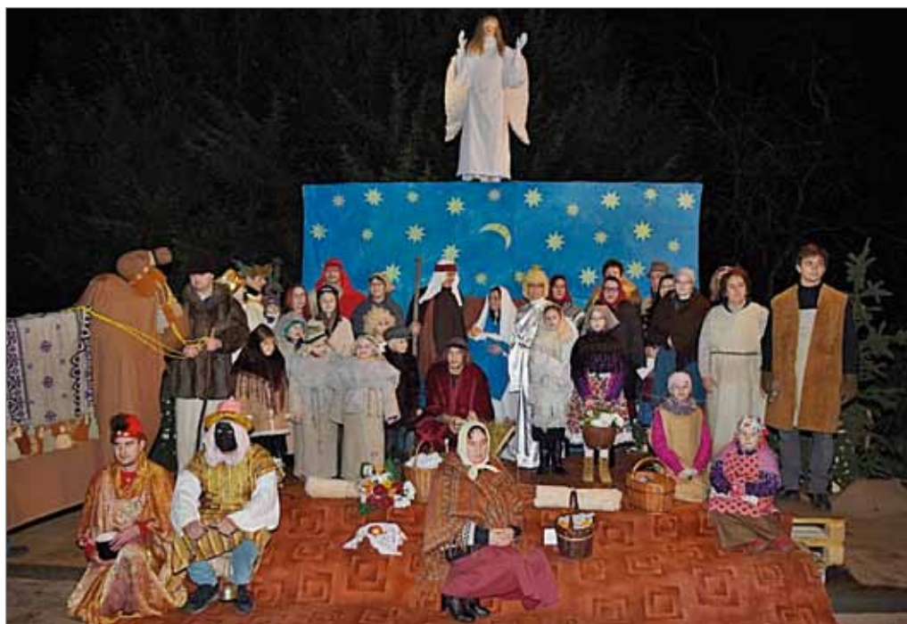
Živý betlém, 23. prosince 2018