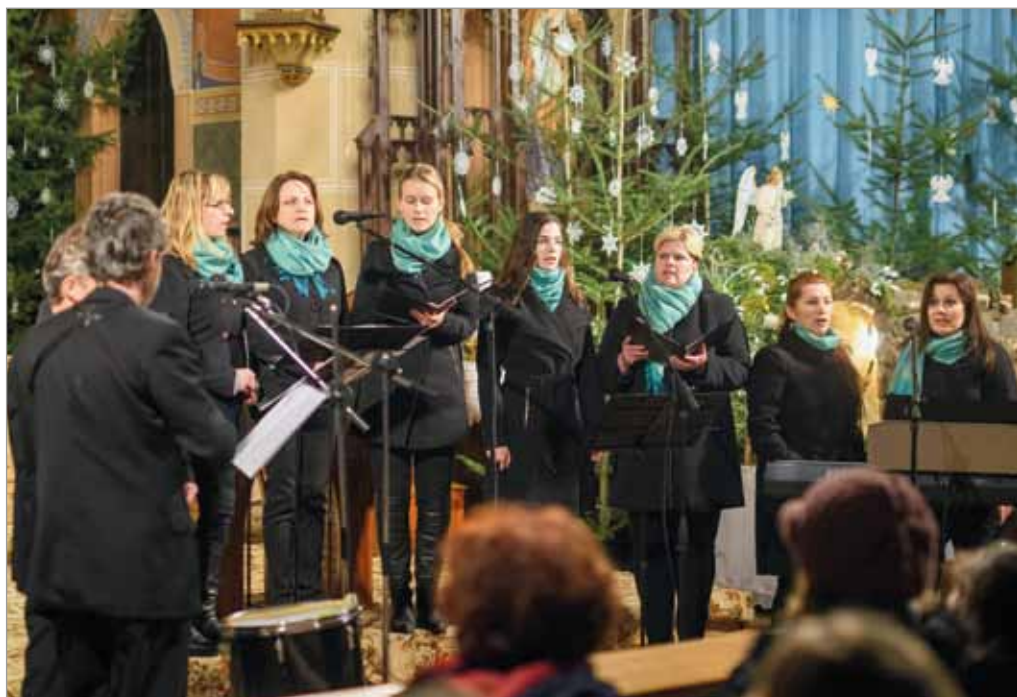
Vánoční koncert, komorní pěvecký sbor DANIELIS, 28. prosince 2018