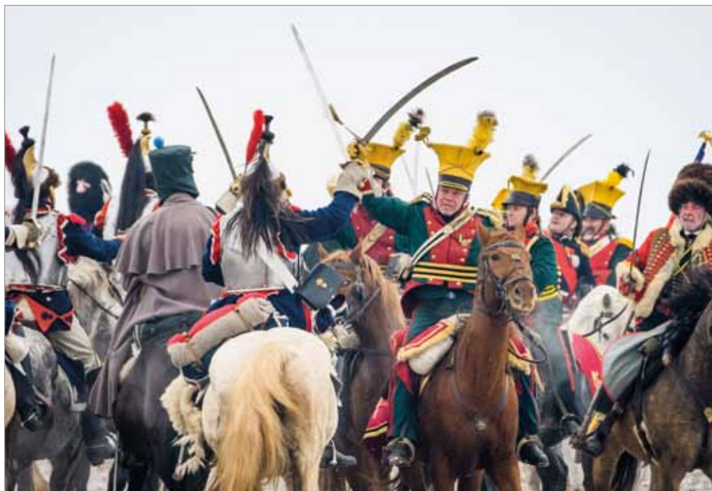
Vzpomínkové akce, 213. výročí bitvy tří císařů, 1. prosince 2018