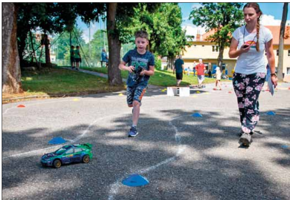
Závody RC modelů, 12. července 2020