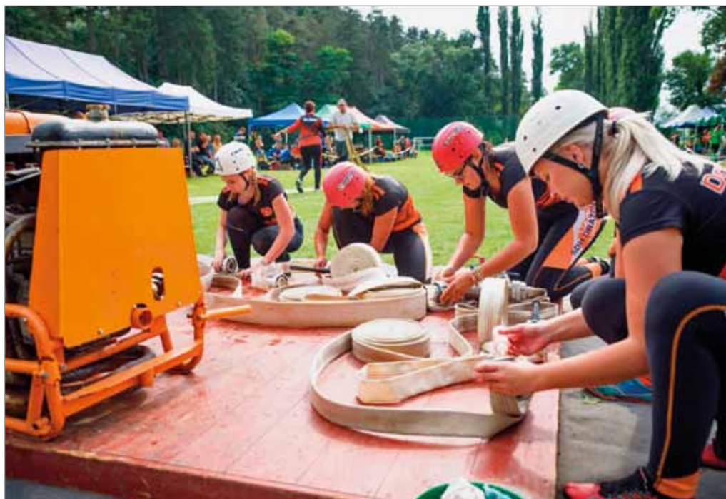
Soutěž v požárním útoku O pohár starosty SDH Tvarožná, 15. srpna 2020