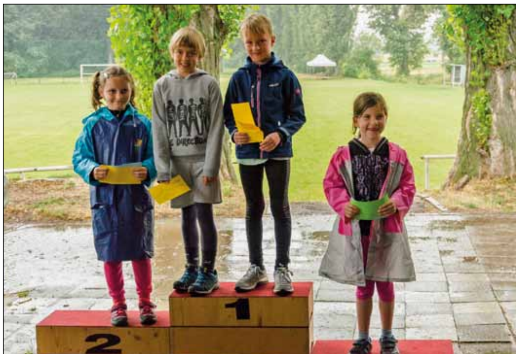
Tvaroženská olympiáda, 3. srpna 2020