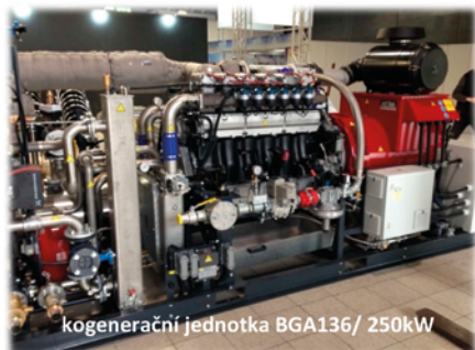
kogenerační jednotka BGA136/ 250kW

Připojte se k týmu odborníků, kteří se vyznají!