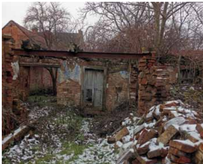
Dům č. 12 současný stav