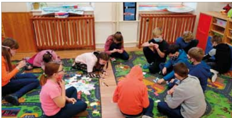
Výuka – žáci 4. ročníku

Také pololetní třídní schůzky plánované na středu 13. ledna pro-