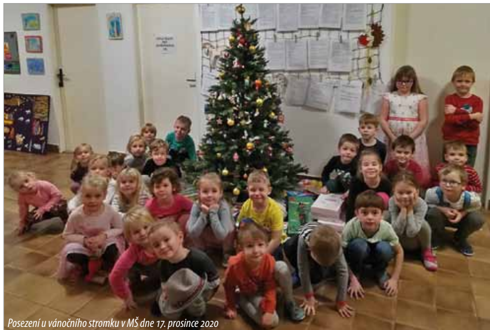
Posezení u vánočního stromku v MŠ dne 17. prosince 2020