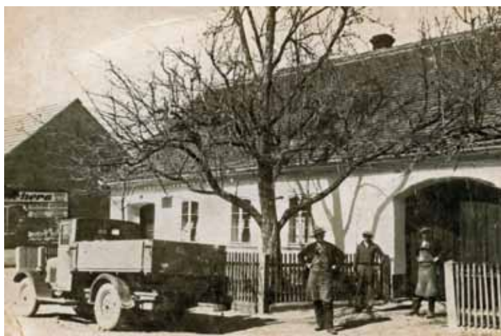
Dům č. 13 před zbořením v r. 1938