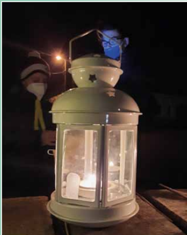
Betlémské světlo, 23. prosince 2020