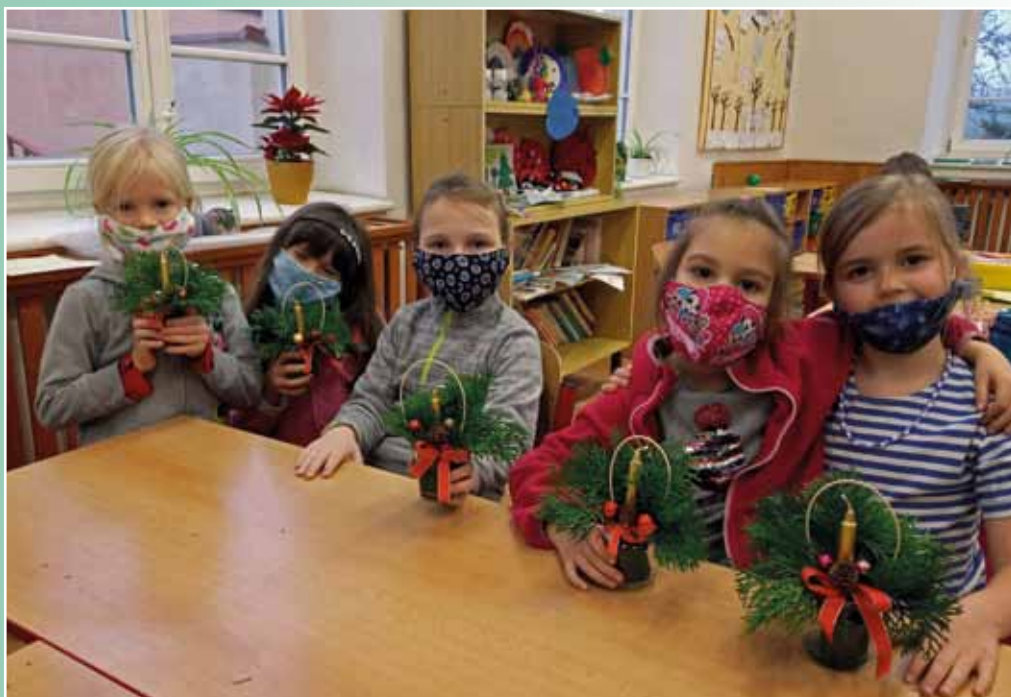
Vánoční dílničky v základní škole, 17. prosince 2020