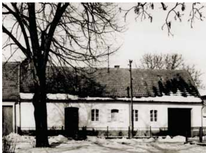
Dům č. 11