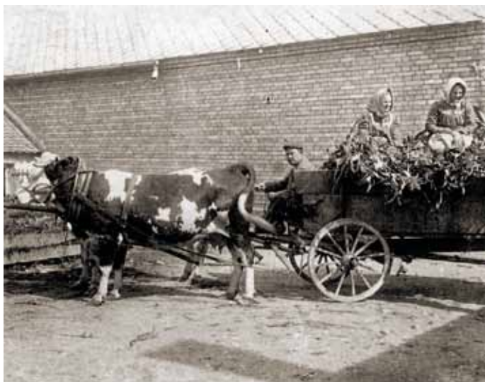
Dům č. 13, dvůr, kravský potah