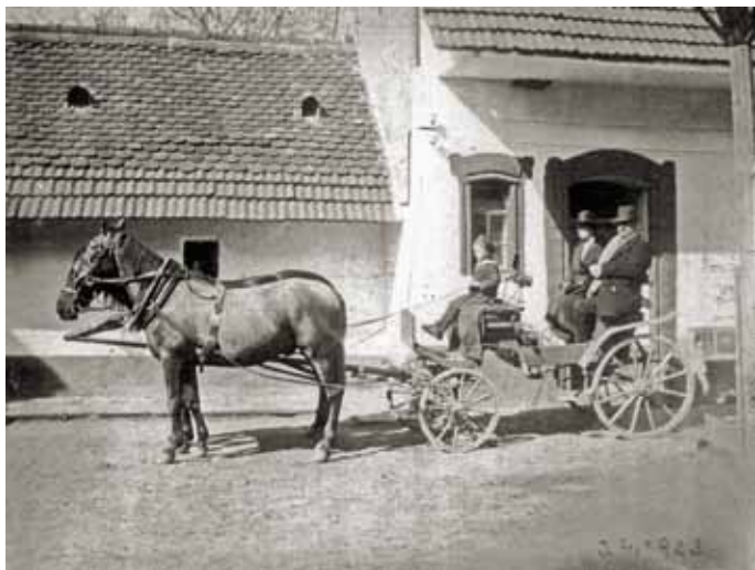
Dům č. 13, dvůr, kočár