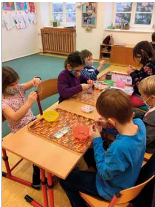
Vánoční tvoření 17. prosince 2020

jít jen žáci 1. a 2. ročníku a ostatní žáci jsou doma na distanční výuce. Vzhledem