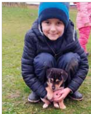
Pejskové na školní zahradě 18. prosince 2020

Na další měsíce máme naplánováno mnoho aktivit, včetně plavání. Zatím je to pouze plán, ale myslíme, že se všechno zrealizuje a děti budou spokojené jako v minulých letech.