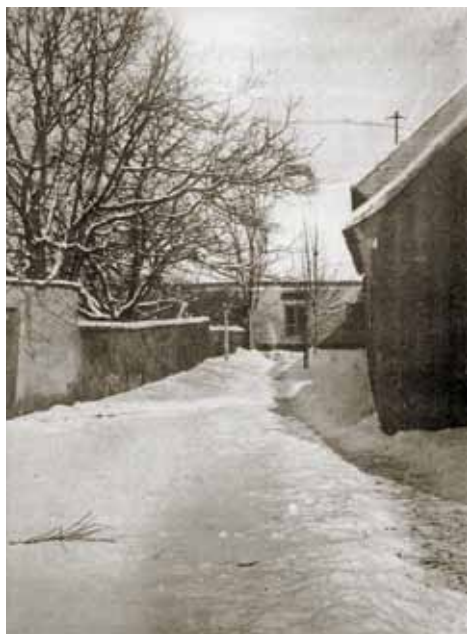
Dům č. 12 v zimě