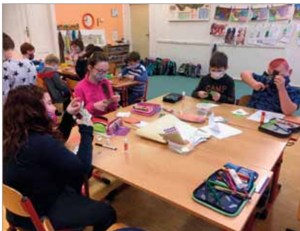
Vánoční tvoření 17. 12. 2020