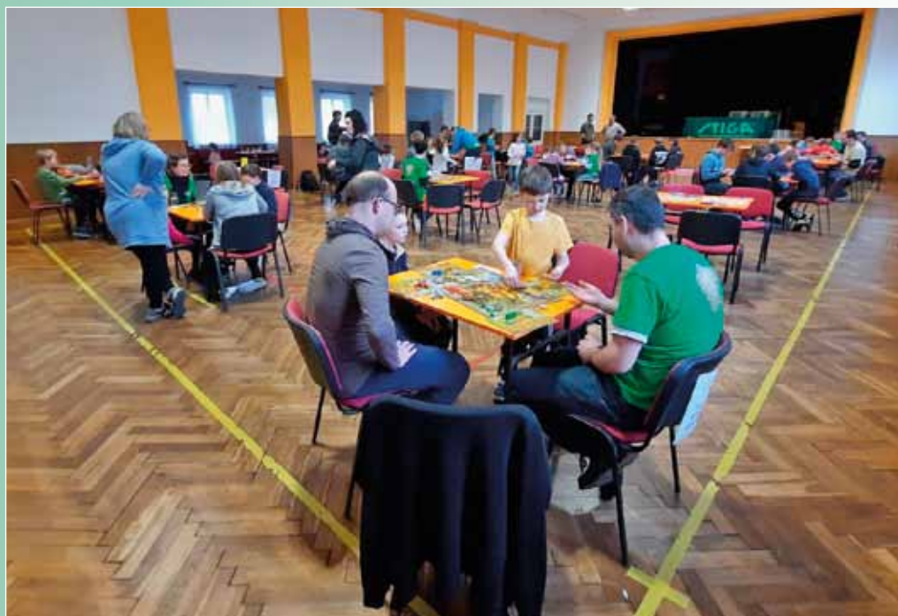
Skautské Deskohrátky, 19. února 2023