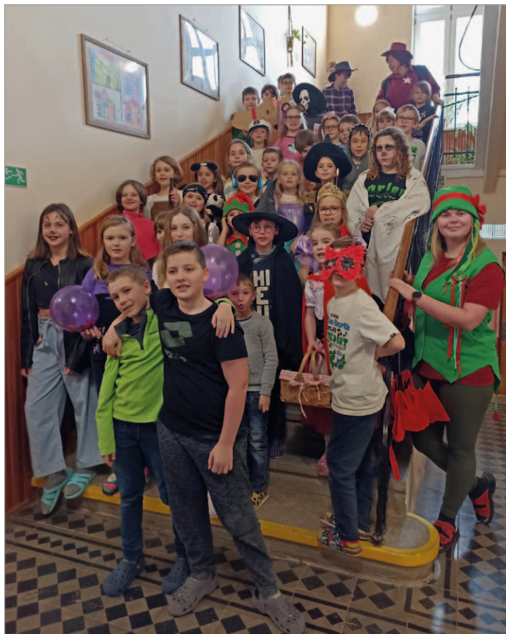
Masopust v ŠD