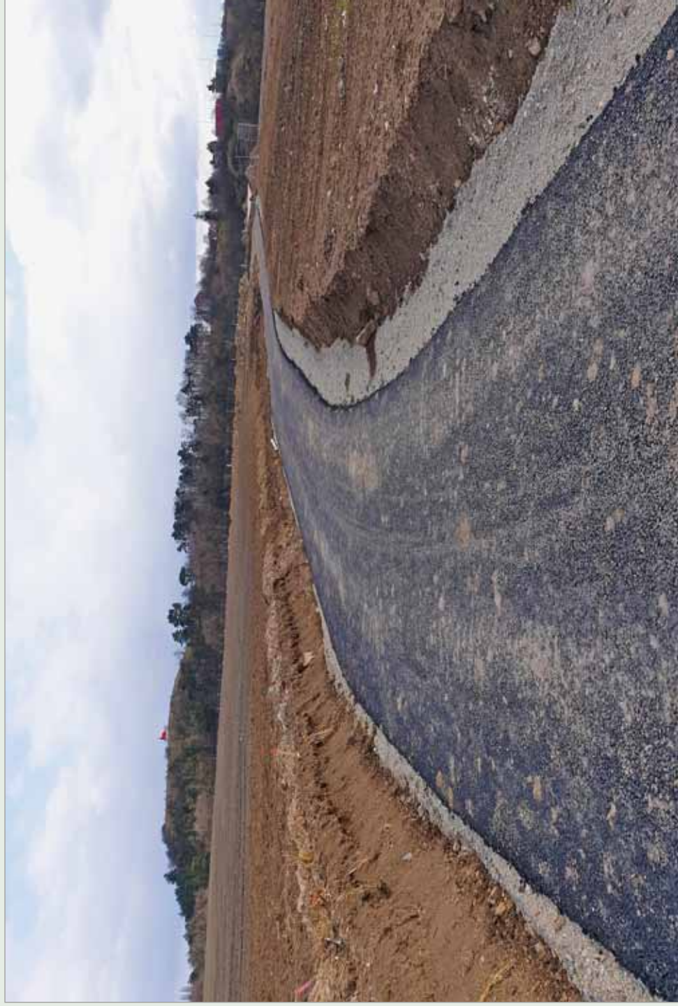
Probíhající výstavba cyklostezky u Tvarožné