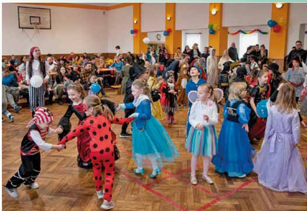
Dětský karneval TJ Sokol, 12. února 2023