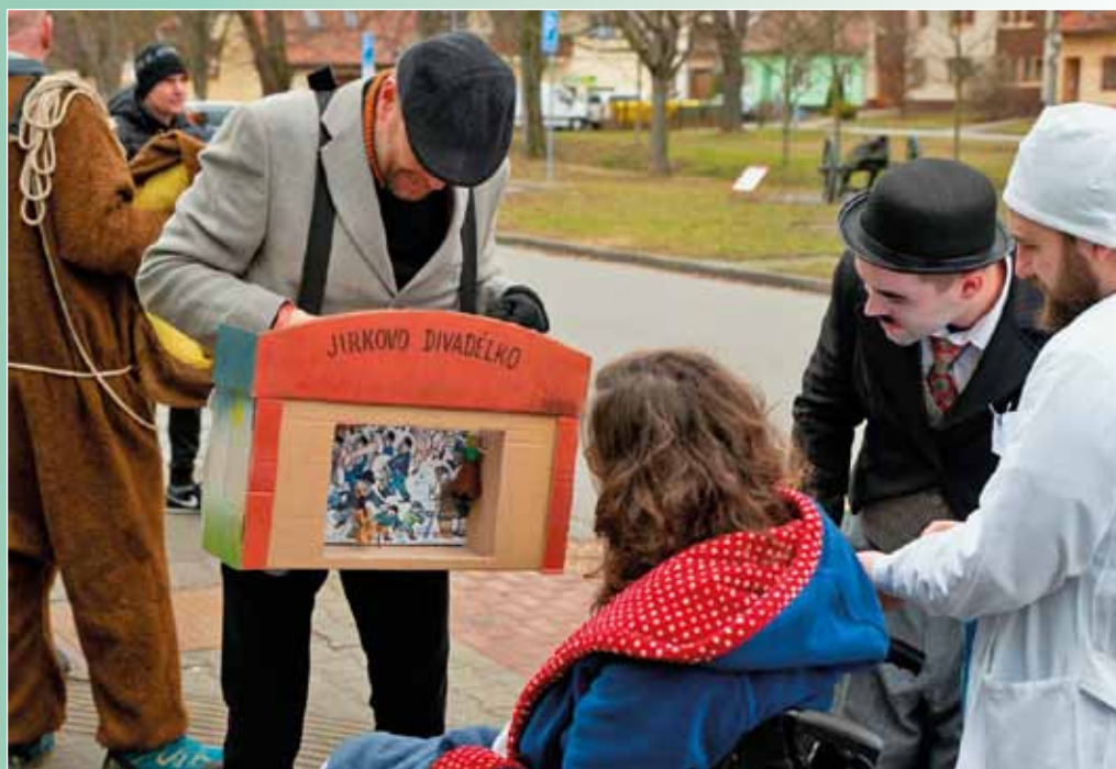
Hasičské ostatky, 18. února 2023