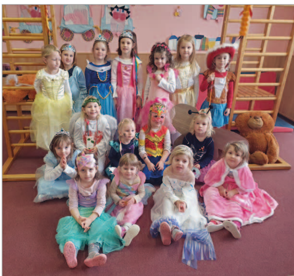
Karneval v MŠ 14. února

doma i ve školce tu správnou atmosféru, sejdeme se všichni na jarních dílničkách, a to 28. března Rodiče s dětmi si tam budou moci vyrobit jarní výzdobu, věnečky na dveře nebo tradičně nazdobit perníčky.