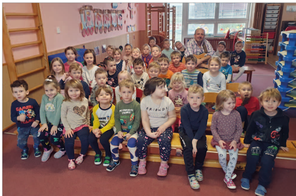
Zimní zpívánky v MŠ 31. ledna

na téma „Zimní radovánky“ jsme se pobavili a mnohé se naučili přímo ve školce.