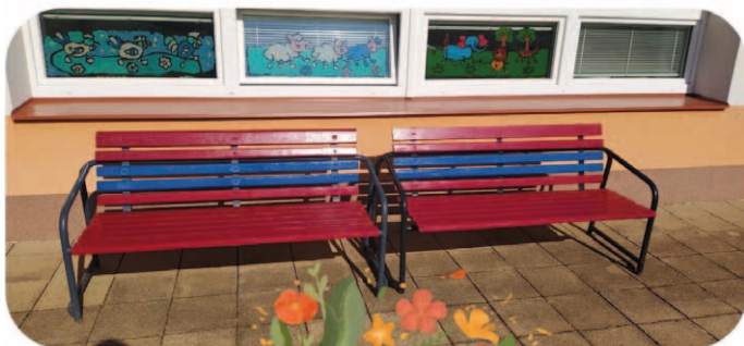
Lavičky opravené panem Buchtov

tímto poděkovali panu Ivanovi Buchtovi za renovaci zahradních laviček a drobné opravy hraček našich dětí.