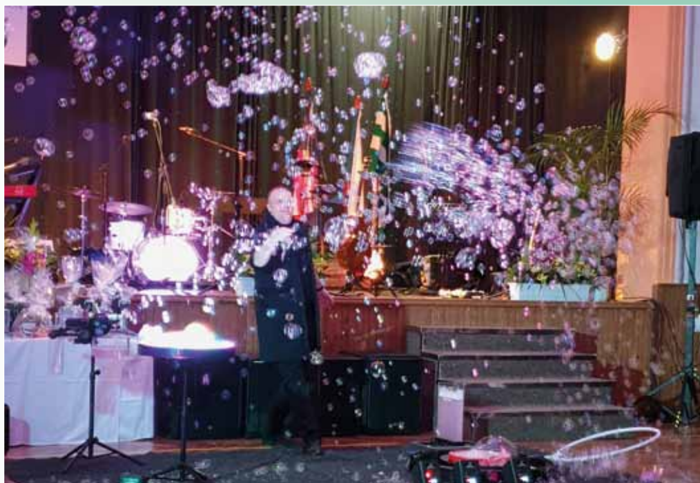
Obecní ples, Bublinová show, 4. února 2023