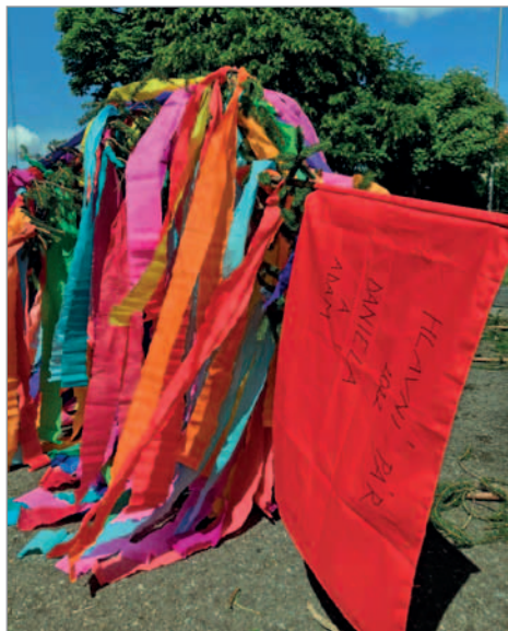
Červený šátek na vrcholku máje se jmenuje hlavního stárkovského páru

Hodový den probíhal následovně. Po vesnici chodili muzikanti a 4 stárky, kteří vyzvedávali stárky z jejich domů. Před domem se rozdávaly poutové koláče, které si stárky na hodový týden samy upekly. Až se do průvodu dostavily všechny stárky, průvod směřoval do tvaroženského kulturního domu, kde se po zbytek odpoledne tancovalo. O půl sedmé večerní zvala