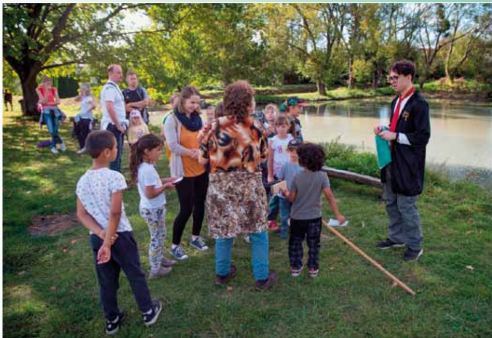
27. skautská Šprýmiáda, 7. října 2023