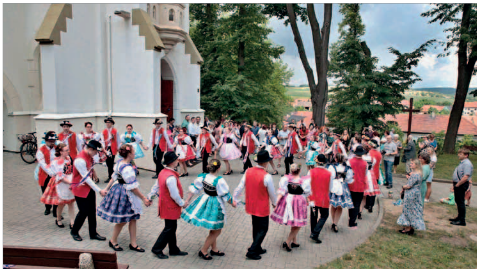
Stárkovské kolečko před kostelem

a je velmi náročné ji z lesa dostat až na cílové místo. Konec stromu se připevňuje k traktoru a v polovině kmene máju podpírá menší vozík. Chlapci ji poté dlouho do noci obušují a připravují její finální verzi. Neobroušená část s větvemi zůstává pouze na horní části stromu.