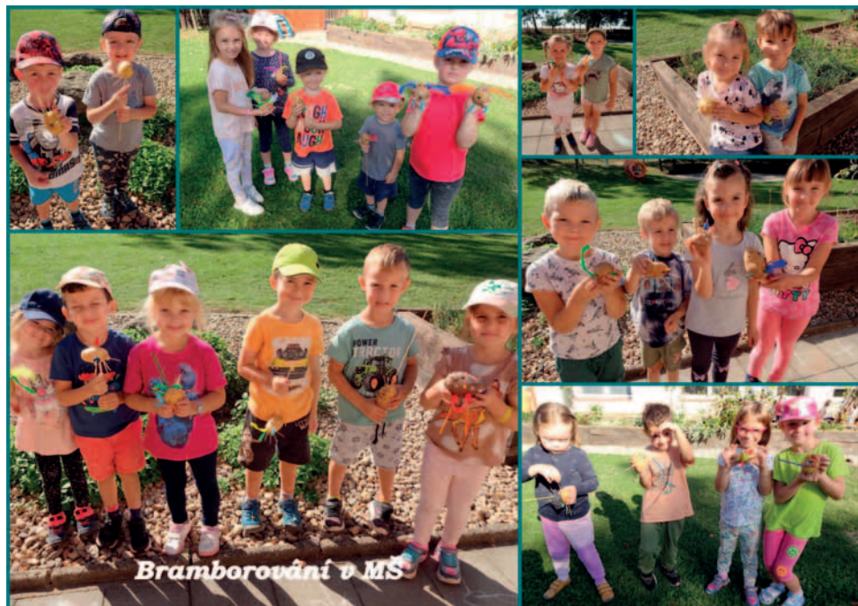
Bramborování v MŠ, 27. 9.