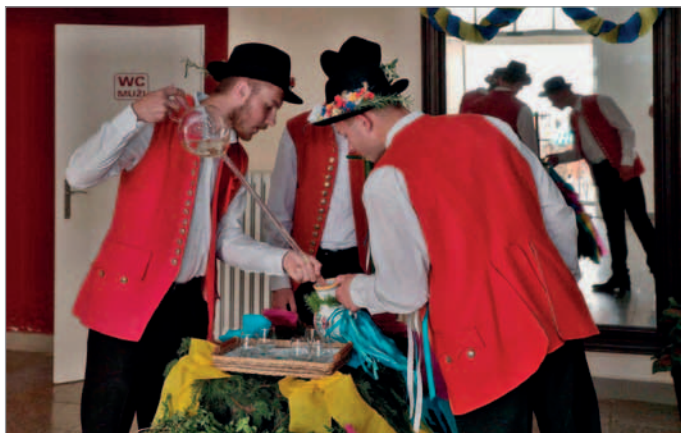
Dolévání vína do džbánu

V roce 1991 došlo ke 3 velkým změnám. V obci se v červnu konalo stoleté výročí založení SDH Tvarožná a hody se díky této slavnosti přesunuly výjimečně na červen. Stárkovské chasy se červnový