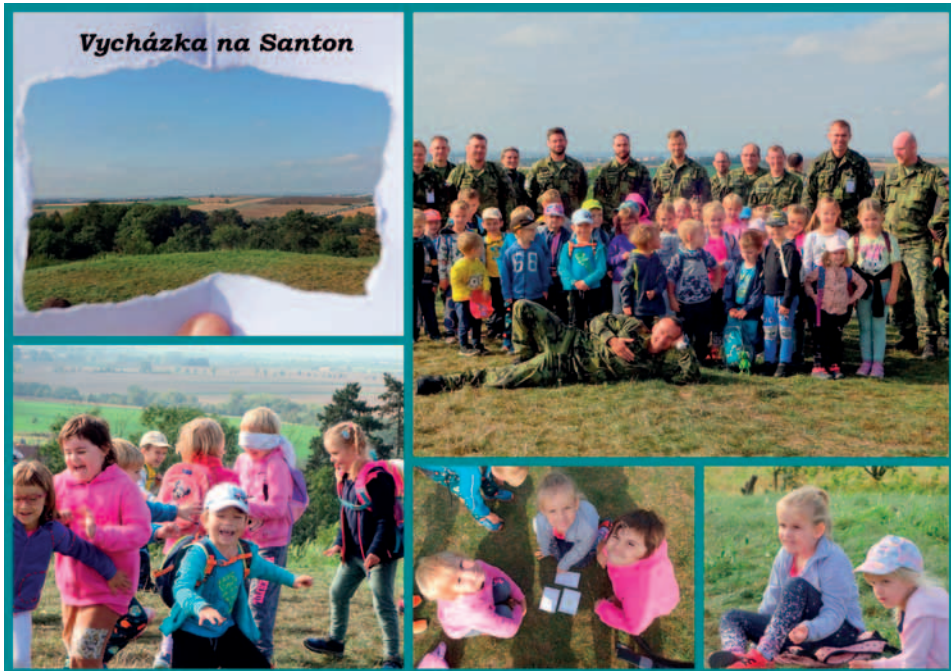
Vycházka na Santon, 23. 9.