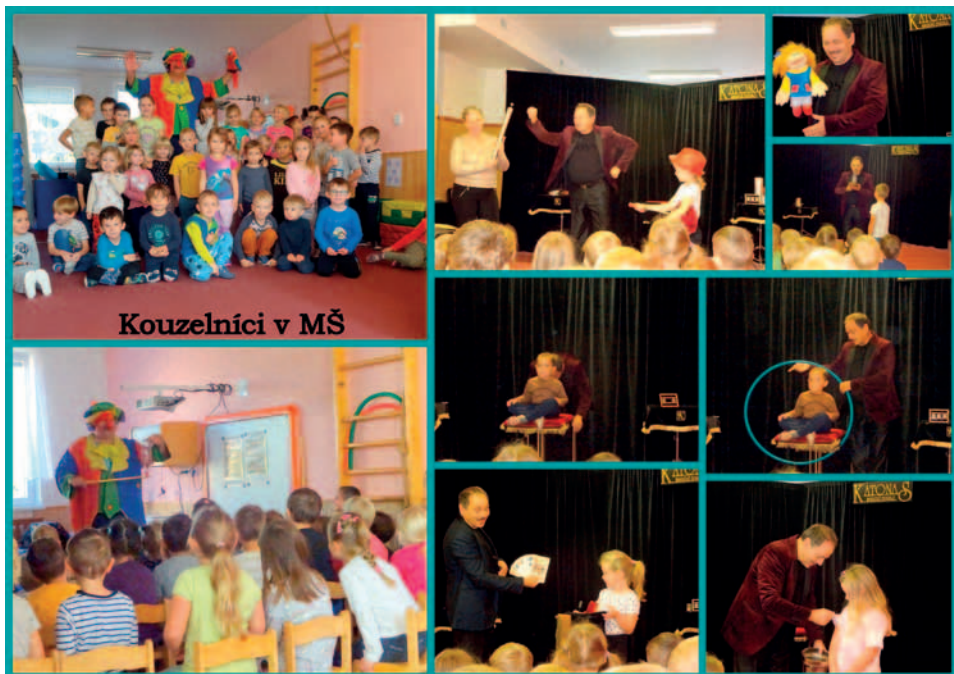
Kouzelníci v MŠ, 18. a 24. 10.