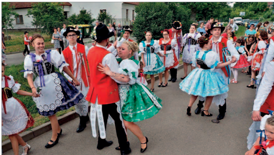
Sólo stárků před domem stárek

uváže zástěru. Mezitím stárci před domem v kolečku zpívají. Jakmile zazní fanfára, pár zajuchá, vychází z domu a míří do kolečka stárků. Při každém zajuchání stárka zvedá rozmarýn a stárek klobouk. Začíná hrát hudba a pár tančí polku. Rodina stárky mezitím roznáší cukroví a pálenku. Po dotančení se zazpívá ještě jedna píseň a odchází se k dalšímu domu. Když se chasa nachází u hlavní stárky, bývá sólo pro hlavní pár, který tančí s ostatními stárky.