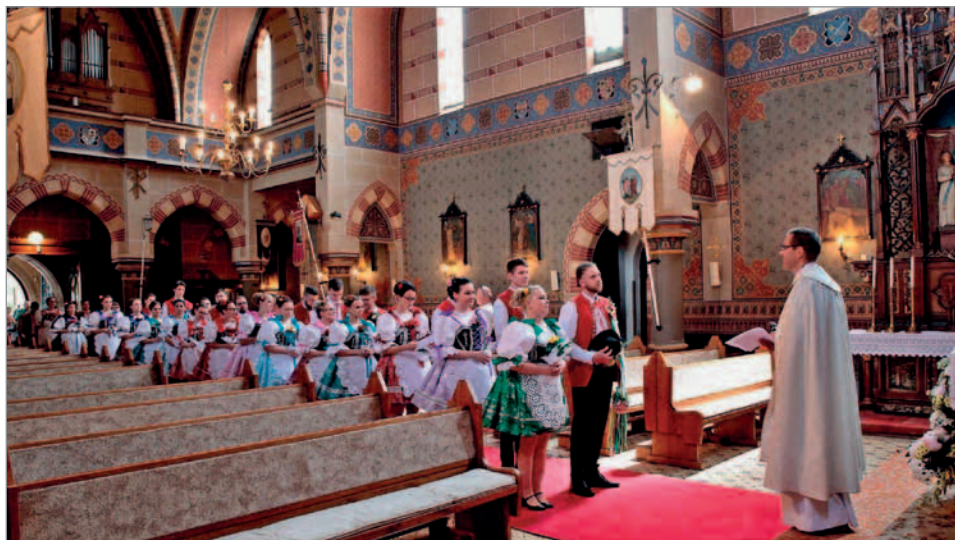
Požehnání stárkům v kostele sv. Mikuláše