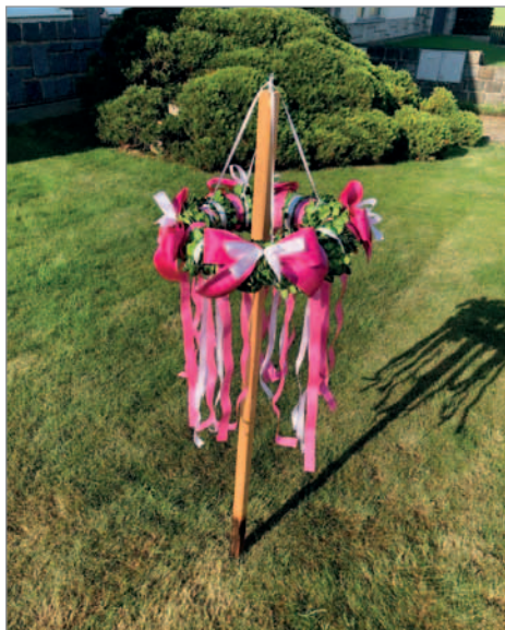
Věneček před domem stárky