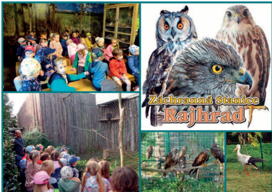
Záchranná stanice Rajhrad, 5. 10.