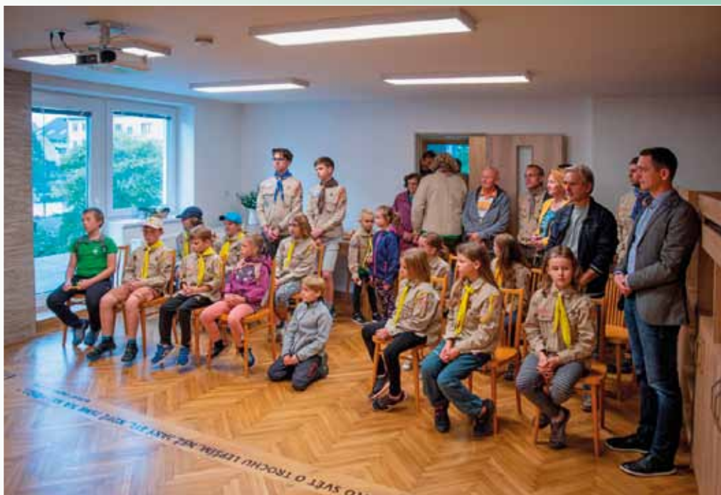
Slavnostní otevření Komunitního centra, 7. října 2023