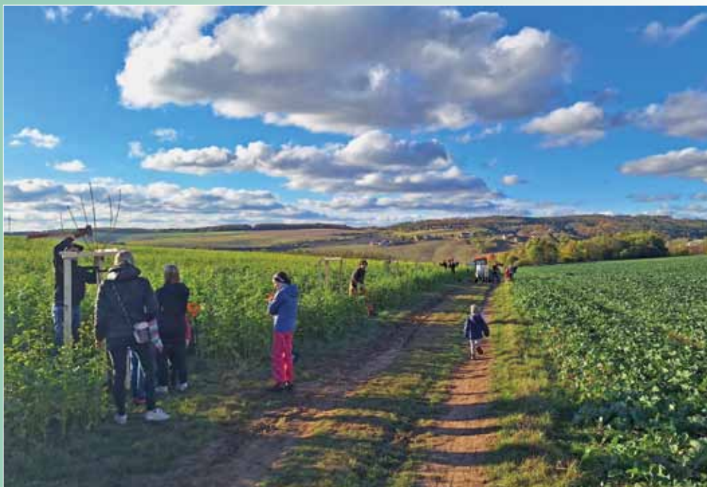
Výsadba stromů za Masarykovou alejí, 4. listopadu 2023