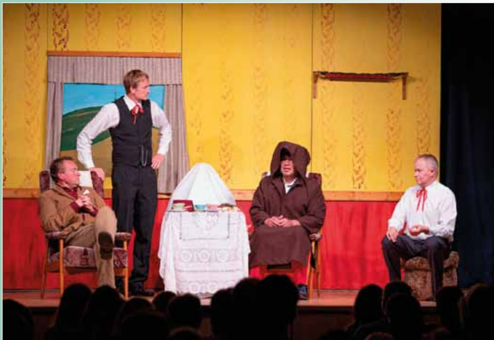
Divadelní vikend na Sokolovně, 14. října 2023