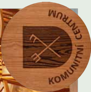
Nové Komunitní centrum