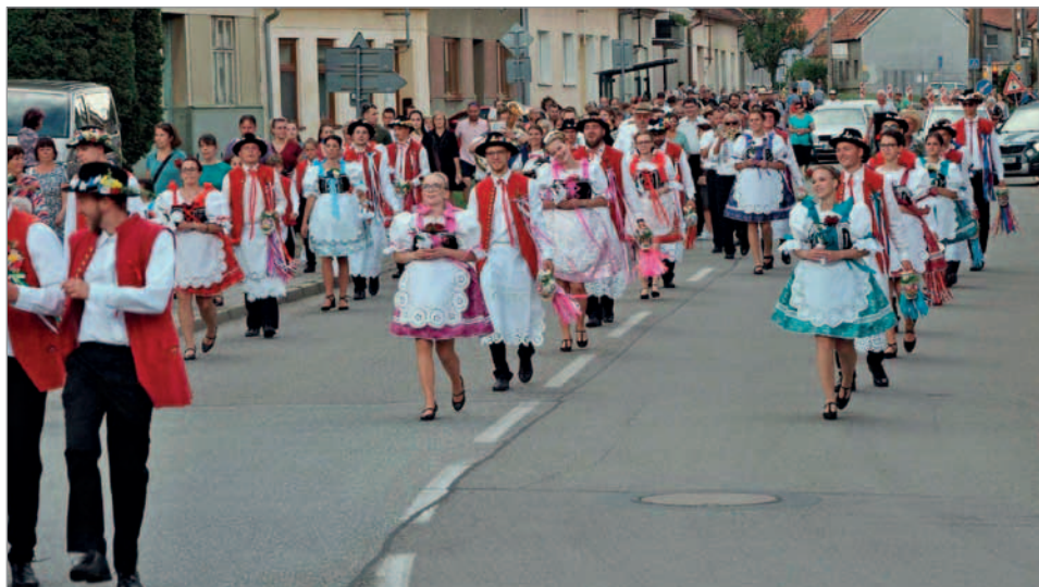
Hodový průvod

Pan starosta nechcò nikoho vidět v roztrhaných gatách, v umatlané košuli, nebo dokonce nekeho nevholeného.