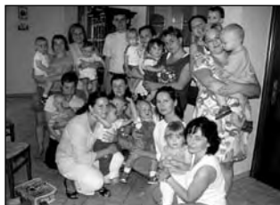
Setkání na faře