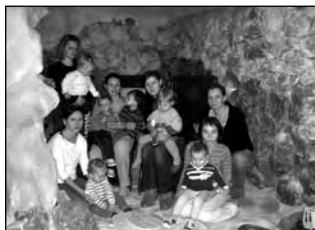
Návštěva solné jeskyně