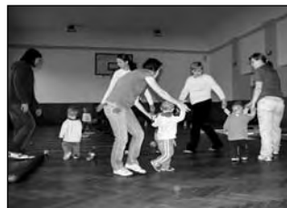
Cvičení v Kosmáku