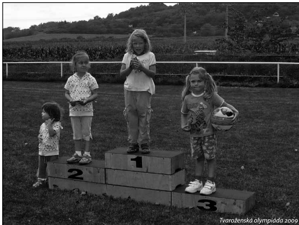
Tvaroženská olympiáda 2009