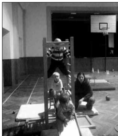
Cvičení rodičů s dětmi