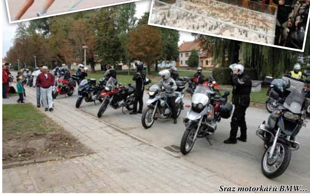
Sraz motorkárů BMW...