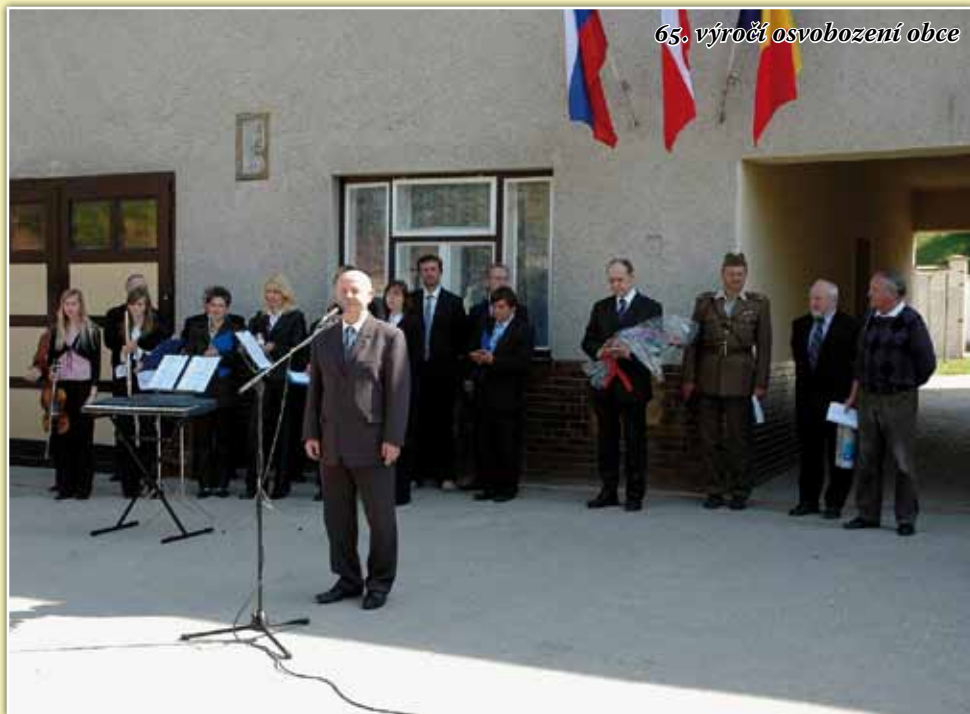
65. výročí osvobození obce