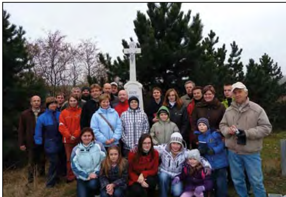
Žehnání kříže u dálnice, 20. 11. 2011