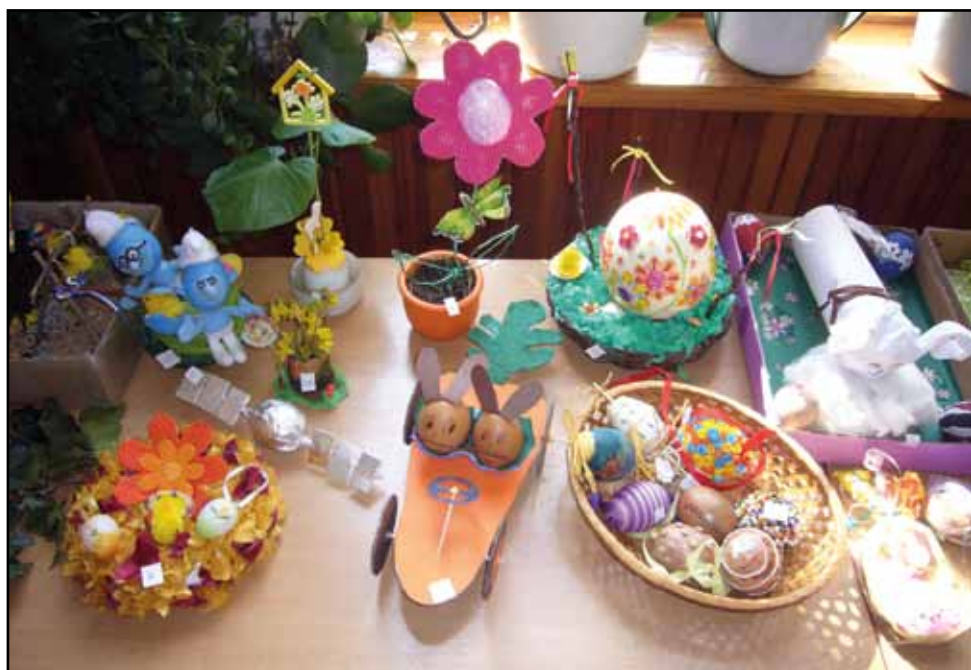
O nejkrásnější kraslici, ZŠ Tvarožná, 4. 4. 2012