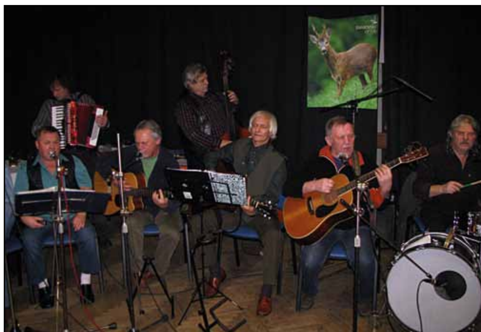
Poslední leč, křest CD Tamburáši, 29. 1. 2012