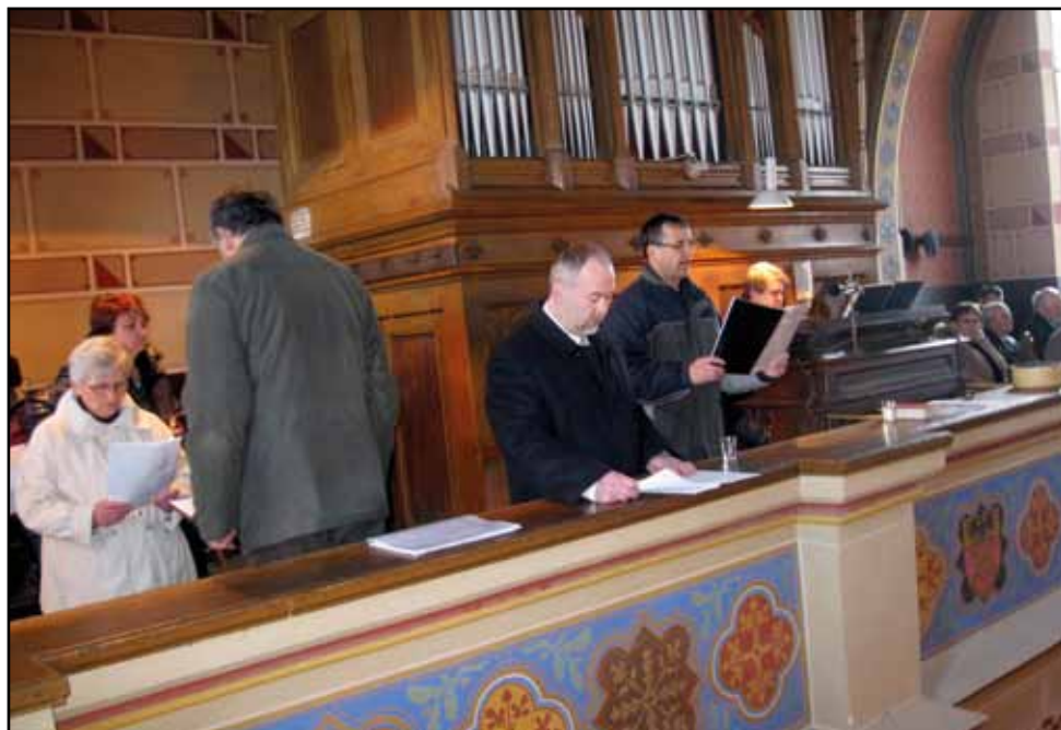
Pašije, kostel sv. Mikuláše, 1. 4. 2012