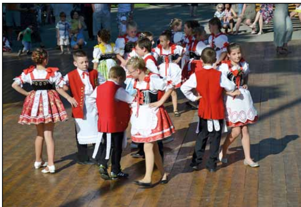
Tvaroženské hody, 16. června 2012