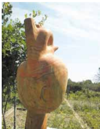
Plastika Srdce, dřevo Zdeněk Kohout

Můžete přijít, nebo přijet na kole na celý den, na odpoledne i večer a poznávat život v údolí Hostěnického potoka a jeho širším okolí – studánky, mokřady, pomníčky, stromy a další krásy našich lesů. Pobyť a příprava jídel v chatě je zdarma. Možnost stanování a večerních besed u táboráku.