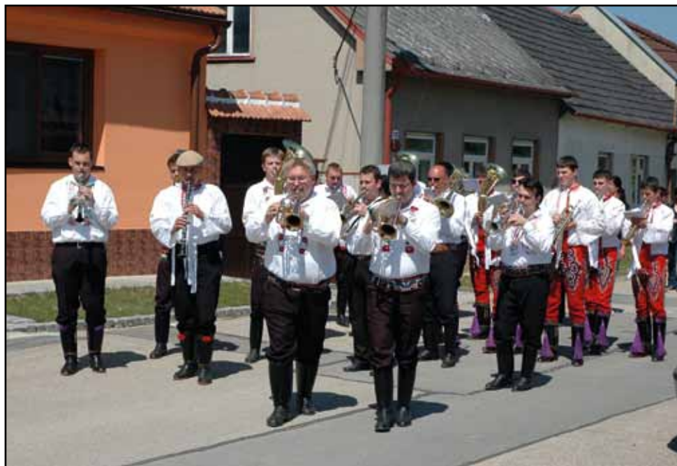
Tvaroženské hudební slavnosti J. Antoše, 20. května 2012