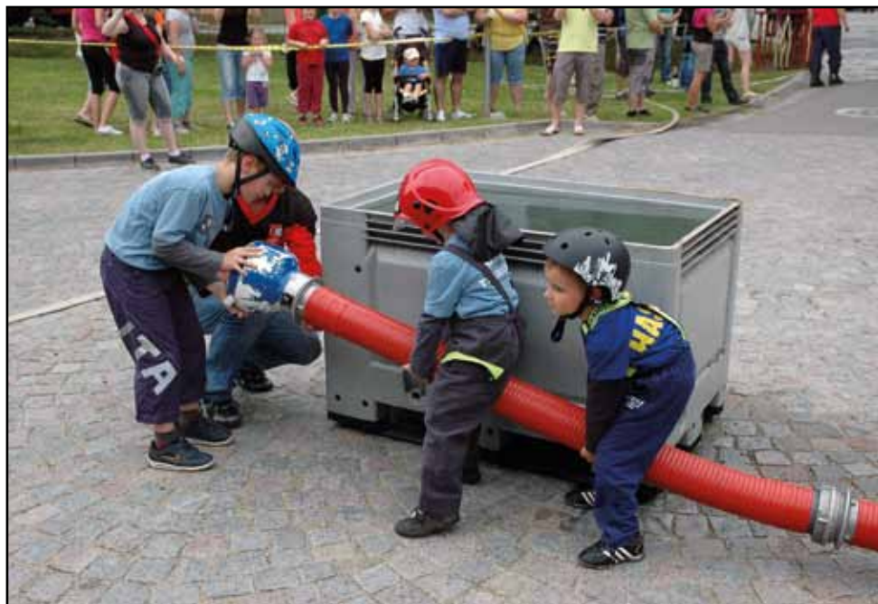
Hasičská soutěž, 3. června 2012