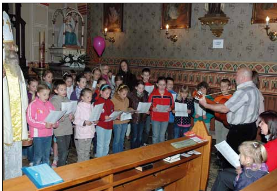
Noc kostelů, 1. června 2012