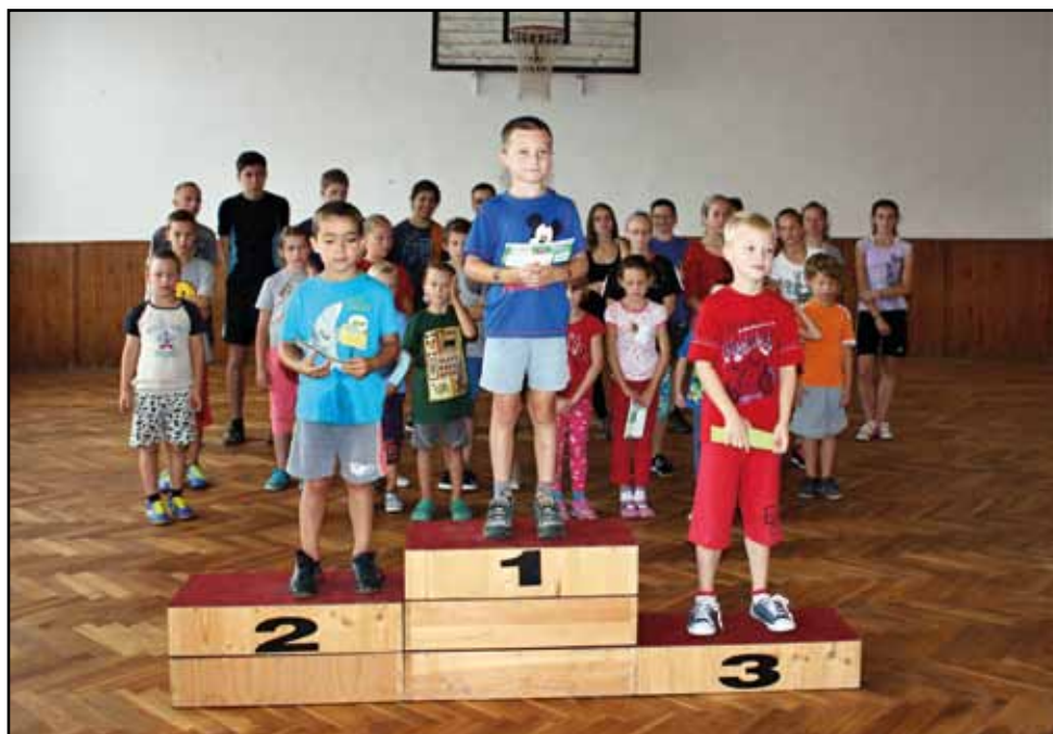
Tvaroženská olympiáda, 5. srpna 2014