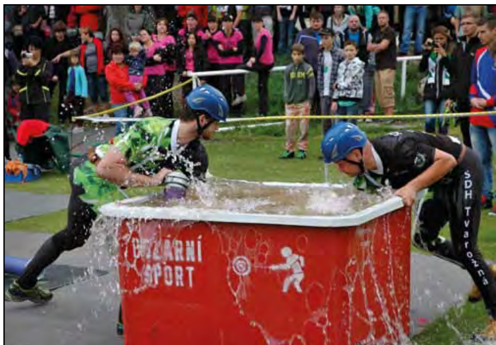
Soutěž O pohár starosty SDH Tvarožná, 31. srpna 2014