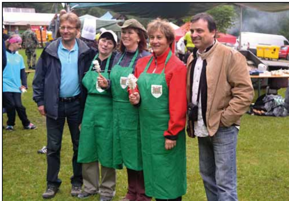
Kvačiansky kotlík, 12. července 2014