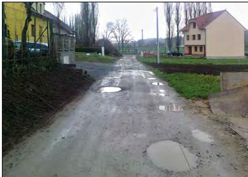
Cesta ke hřišti