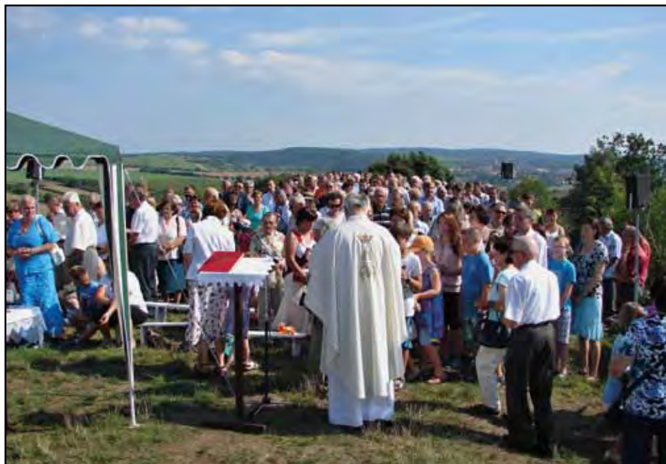
Tvaroženská pouť, 10. srpna 2014