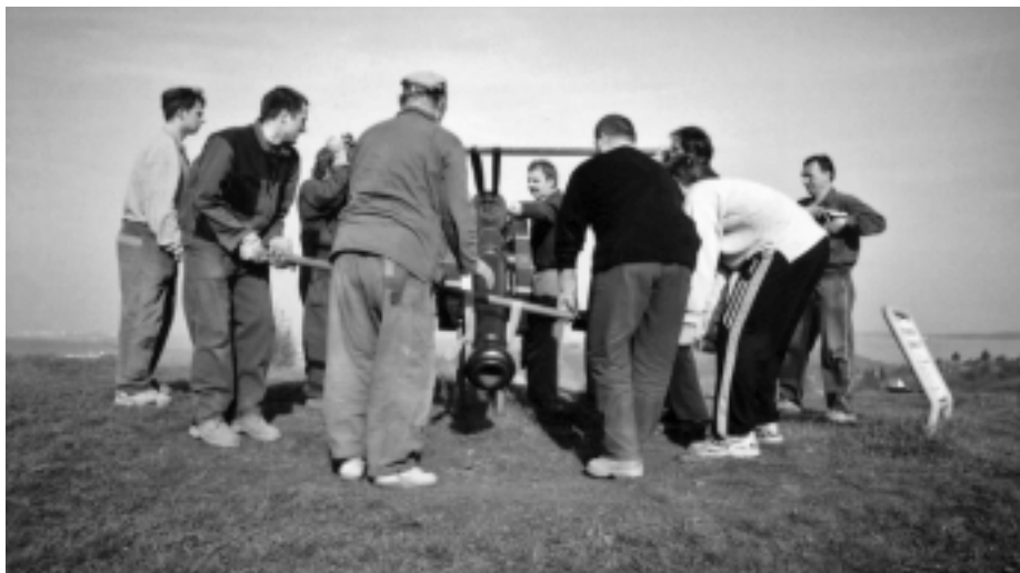
Demontáž kanónu na Santonu.