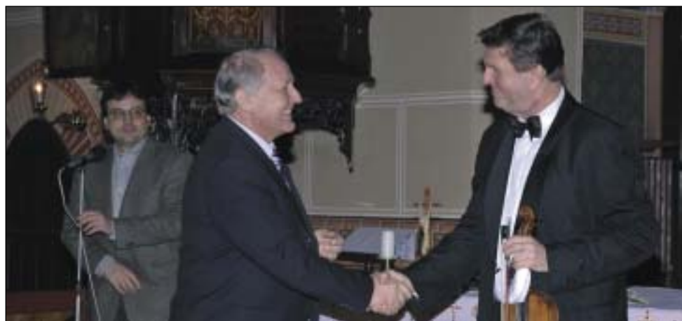
Velikonoční koncert 2006