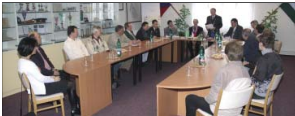
Dohoda o spolupráci s obcí Kvačany