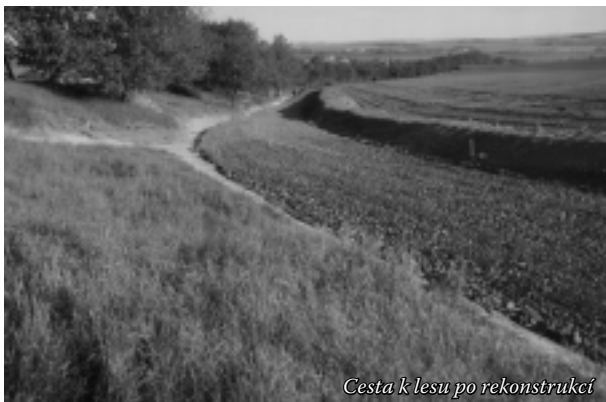
Cesta k lesu po rekonstrukci

které rada obce schválila. Polní cesta byla rozšířena na 4,5 m, zpevněna 250 tunami šterku, který zdarma dodalo až na místo BONAGRO Blažovice, po levé straně byla zbudována záchytná mezka zabraňující vodě téci na cestu. Po pravé straně byl vyhlouben příkop odvádějící vodu od lesa na Desátkové hony. Celá akce trvala 5 dnů od 9. 5. do 13. 5. 2005 a celkové náklady činily 50 767 Kč.