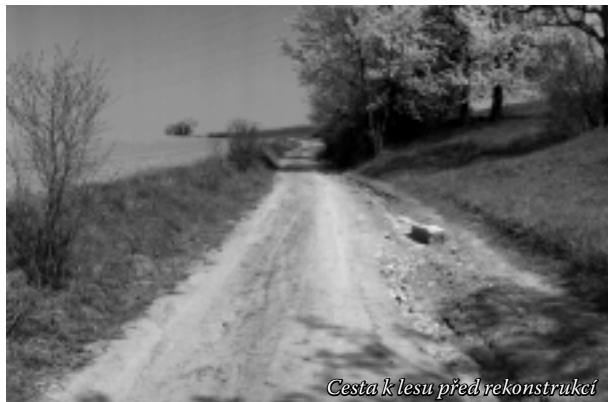
Cesta k lesu před rekonstrukcí

chtějící se zbavit stavební sutě a jiného domovního odpadu, cestu zdevastovali. (Byly tam dokonce i betonové sloupky). Proto byla přizvána ing. Arch. Pavličková, která zpracovala projekt úpravy daného úseku cesty v délce 250 m. Náklady na realizaci ovšem činily 412 000 Kč. Zem. komise navrhla vlastní řešení,