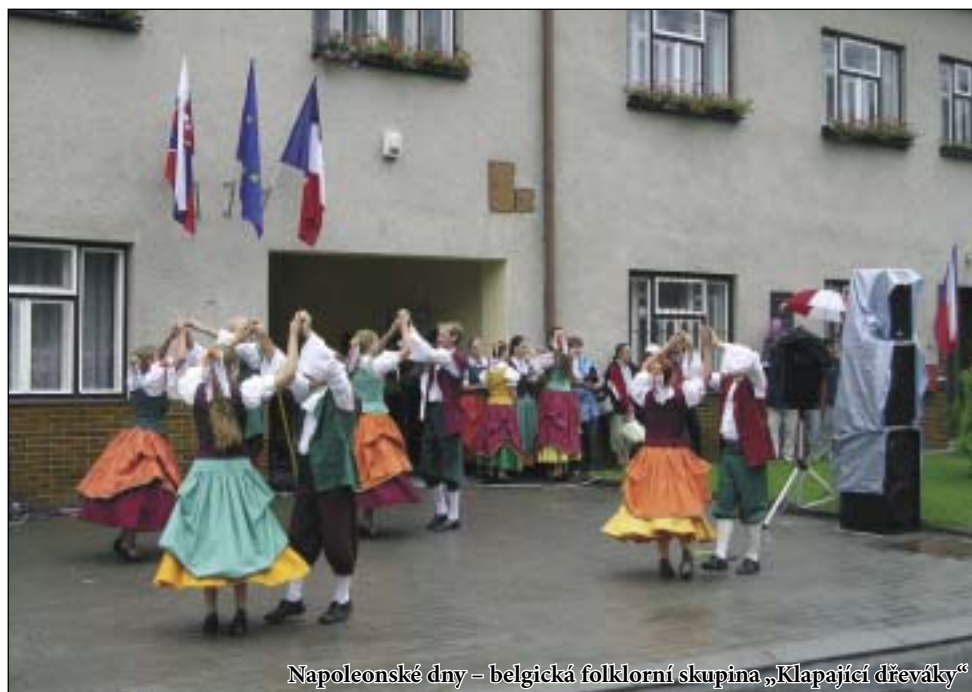
Napoleonské dny – belgická folklorní skupina „Klapající dřeváky“