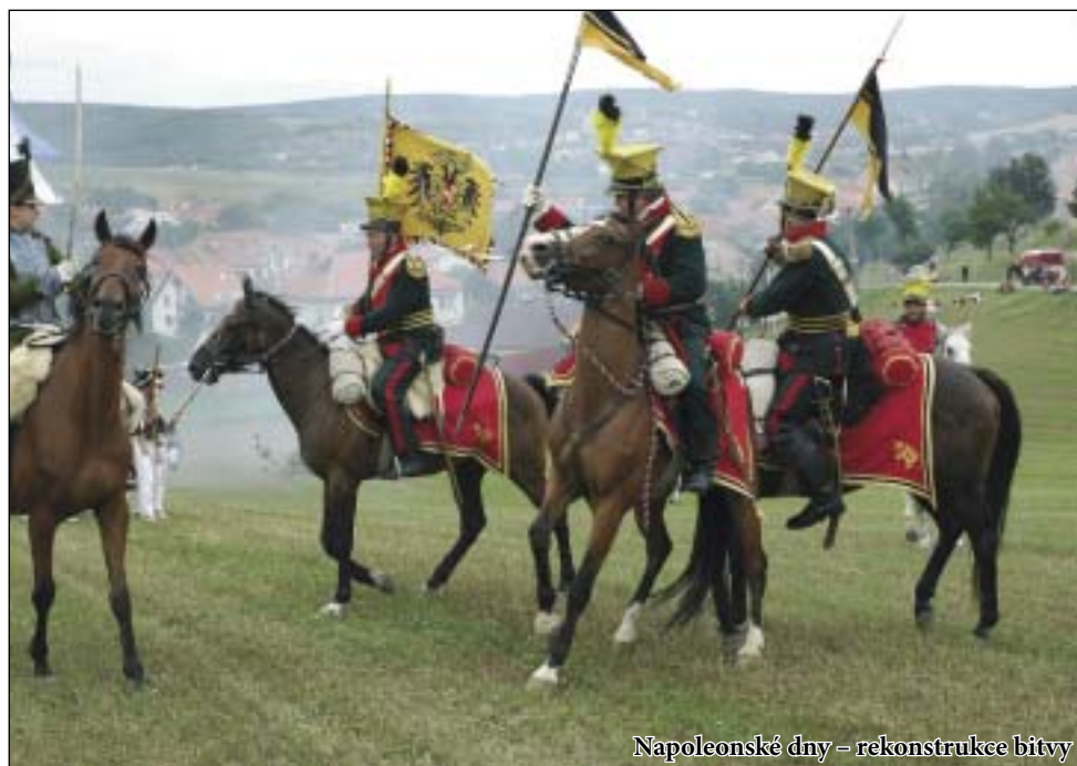
Napoleonské dny – rekonstrukce bitvy