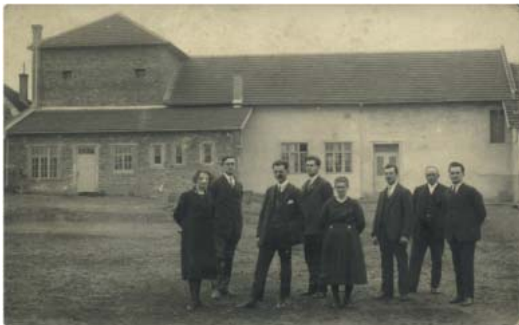
Historické fotografie ze stavby sokolovny