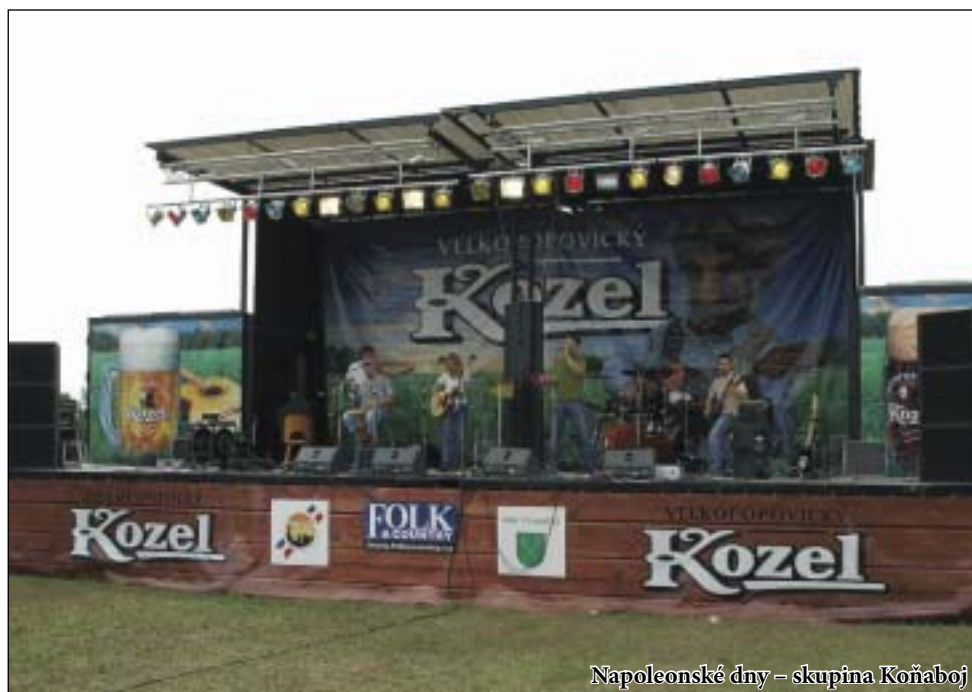
Napoleonské dny – skupina Koňaboj