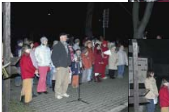
Setkání pod vánočním stromem