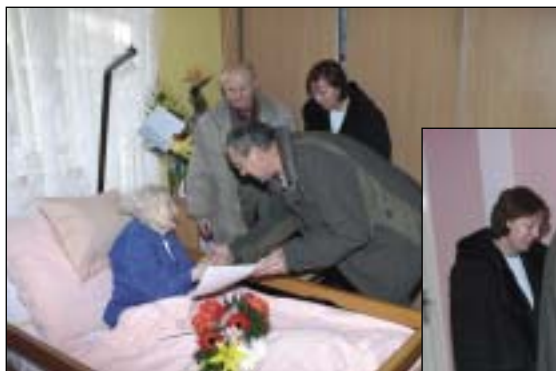
Návštěva v DD Sokolnice