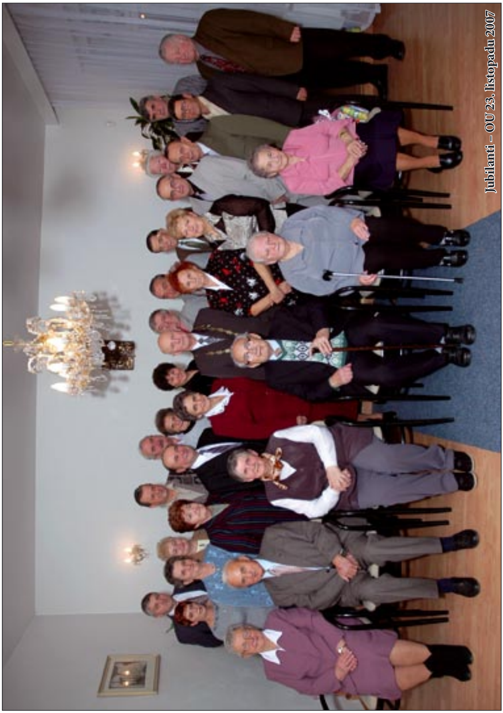
Jubilanti – OU 23. listopadu 2007