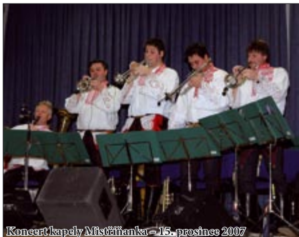
Koncert kapely Místřňanka - 15. prosince 2007