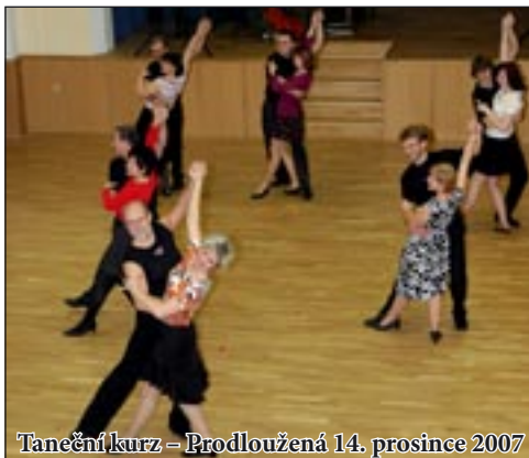
Taneční kurz – Prodloužená 14. prosince 2007