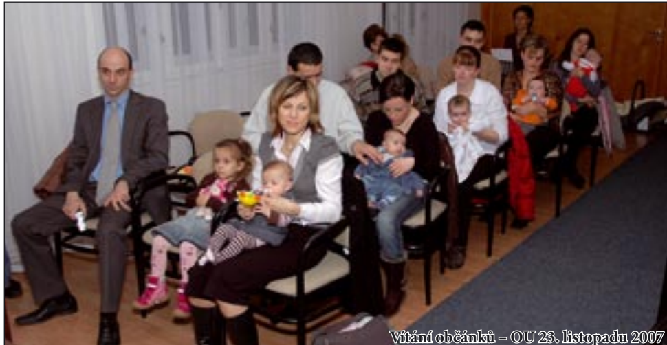
Vítání občánků – OU 23. listopadu 2007