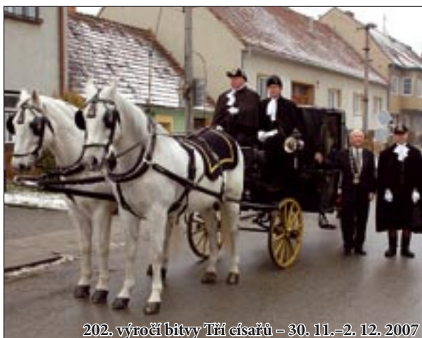
202. výročí bitvy Tří císařů - 30. 11.-2. 12. 2007