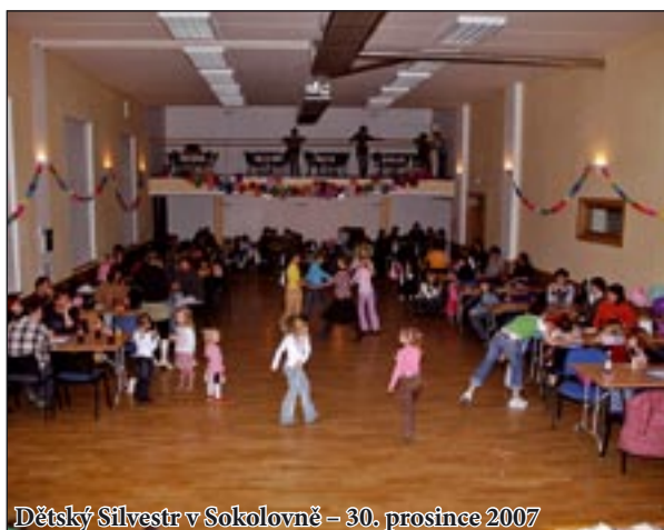
Dětský Silvestr v Sokolovně - 30. prosince 2007