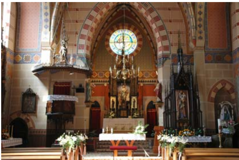
Kostel sv. Mikuláše

Spolu s generální opravou fary bylo vybudováno veřejné WC u kostela.